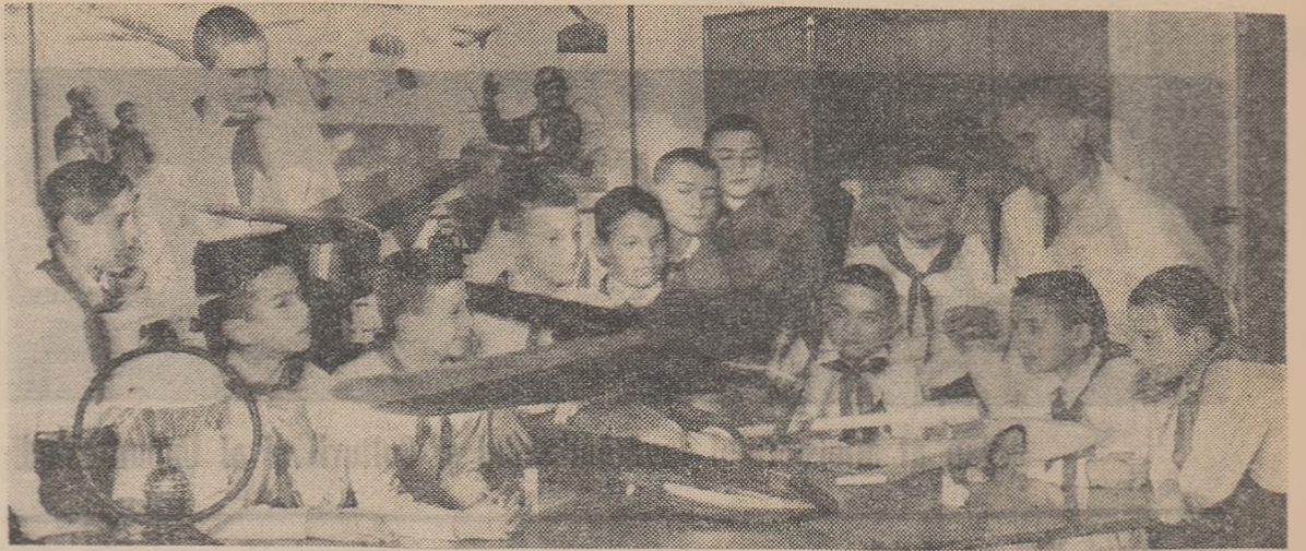
Zeci de modele de cele mai diverse tipuri stau la dispoziția viitorilor cuceritori ai văzduhului, care-și fac inițierea în cercul de aeromodelism al Palatului pionierilor din Capitală.