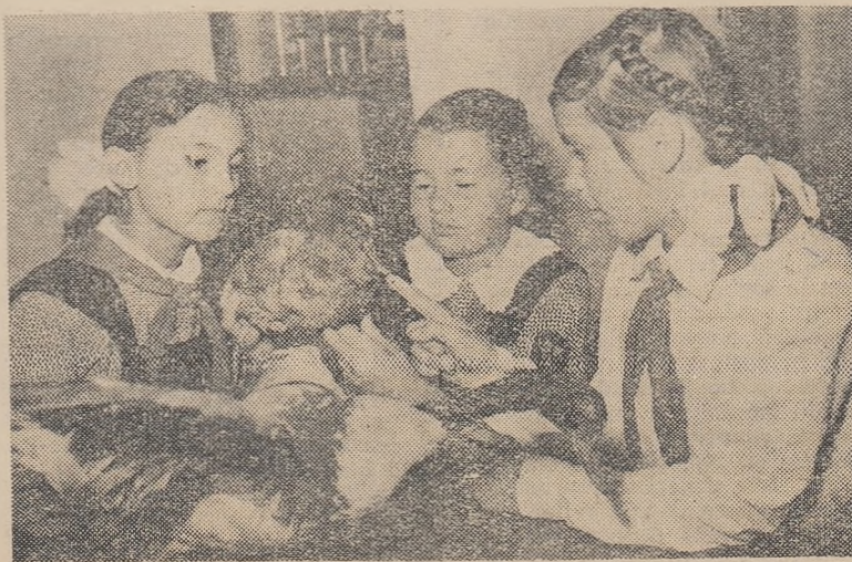
Interesul pentru științele naturale stimulat de profesor le-a călăuzit școlarii pașii spre colțul zoologic, ale cărui expozate le cercetează acum pasionați