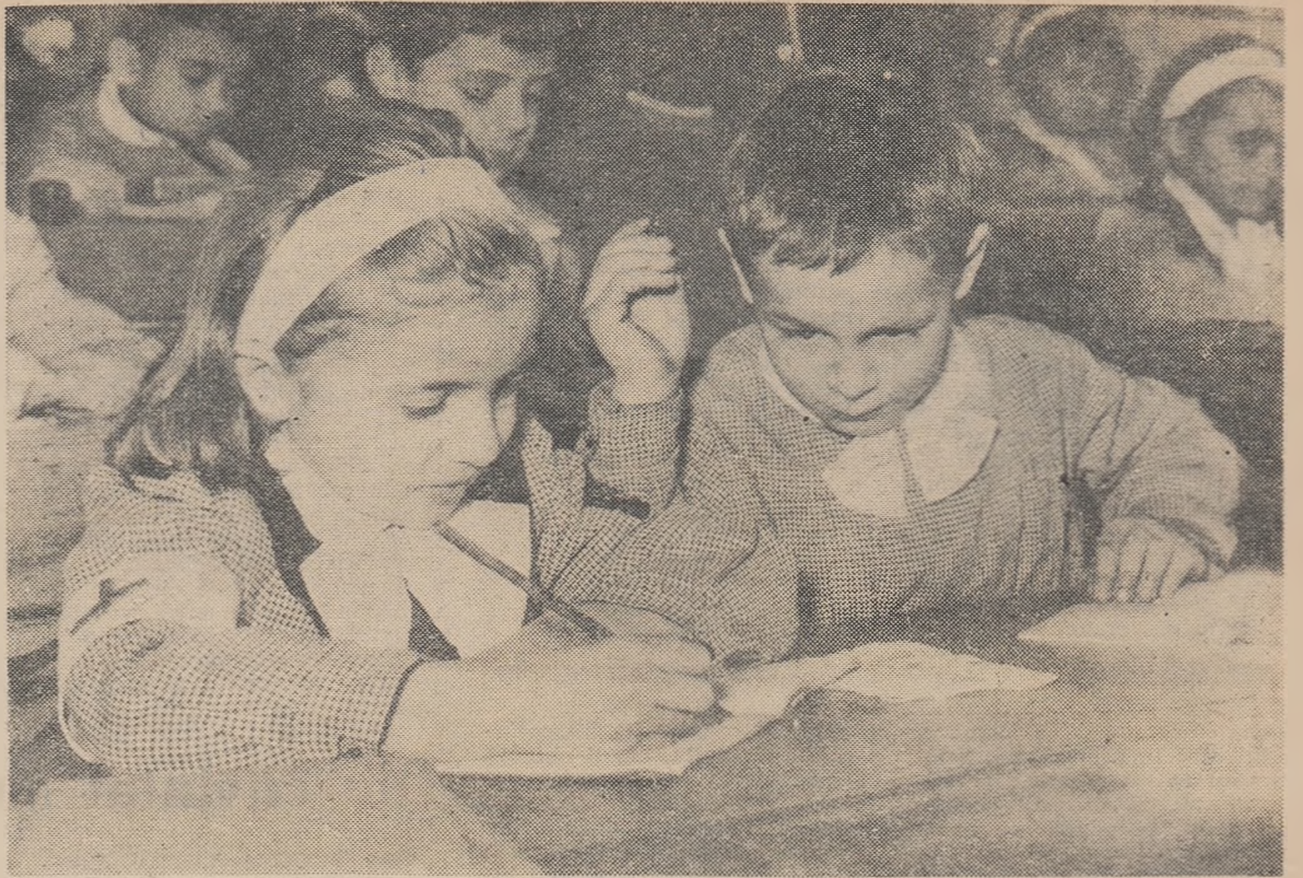
Cum reușește colega mea să scrie atât de frumos?

Programul recentului concert al elevilor de la Școala medie nr. 3 din Sibiu ilustrează preocuparea profesorilor de a dezvolta la copii dragostea pentru muzică, pentru frumos. O preocupare laudabilă.