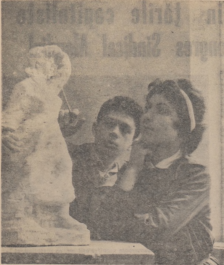
Vitiorii artiști, elevii Școlii medii de arte plastice din Capitală discută cu mult simț critic propriile lor lucrări.