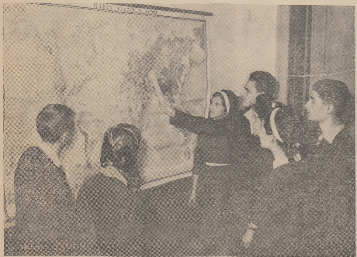
In fața hărții lumii elevii școlii medii „Mihail Eminescu” comentează cu însuflețire ultimele evenimente prezentate în cadrul informărilor politice săptămînale