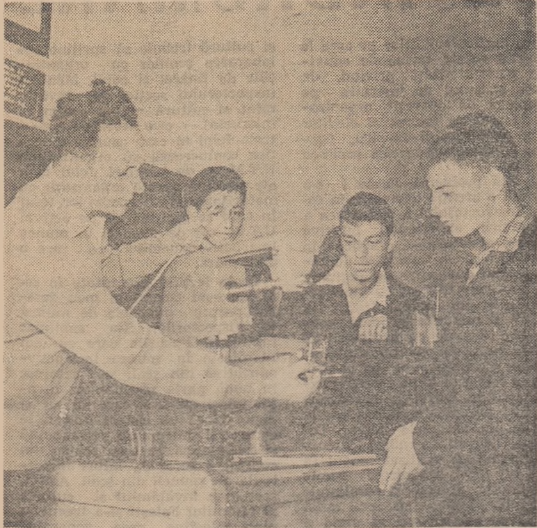
Demonstrații privind funcționarea mașinilor de frezat în cabinetul-laborator de mașini-unelte.