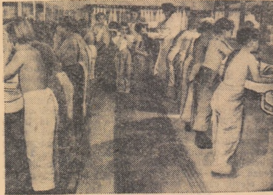
și spălătorul modern și confortabil