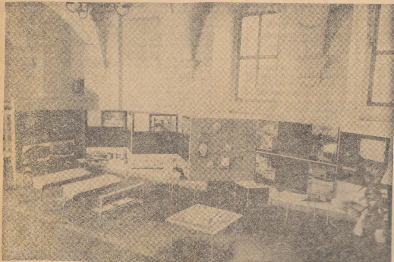
Pașionul nostru la expoziția deschisă la Praga cu prilejul seminarului internațional privind construcțiile de școli.

Abonamentele se pot face la oficiile poștale, prin factorii poștali și prin difuzorii voluntari din școli și instituții.