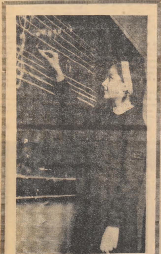
În școlile noastre se dă o deosebită atenție educației estetice a elevilor. Iată o elevă a Școlii medii „N. Bălcescu” din București deslușind tainele contrapunctului.

Copiii au condiții minunate pentru a-și petrece timpul liber în chip cit mai plăcut: un club cu numeroase jocuri de șah, șubah, popice de masă, o bibliotecă cu peste 1500 de volume etc. Iubitorii de muzică, de dans, de teatru pot activa în formațiile artistice create în cadrul casei.