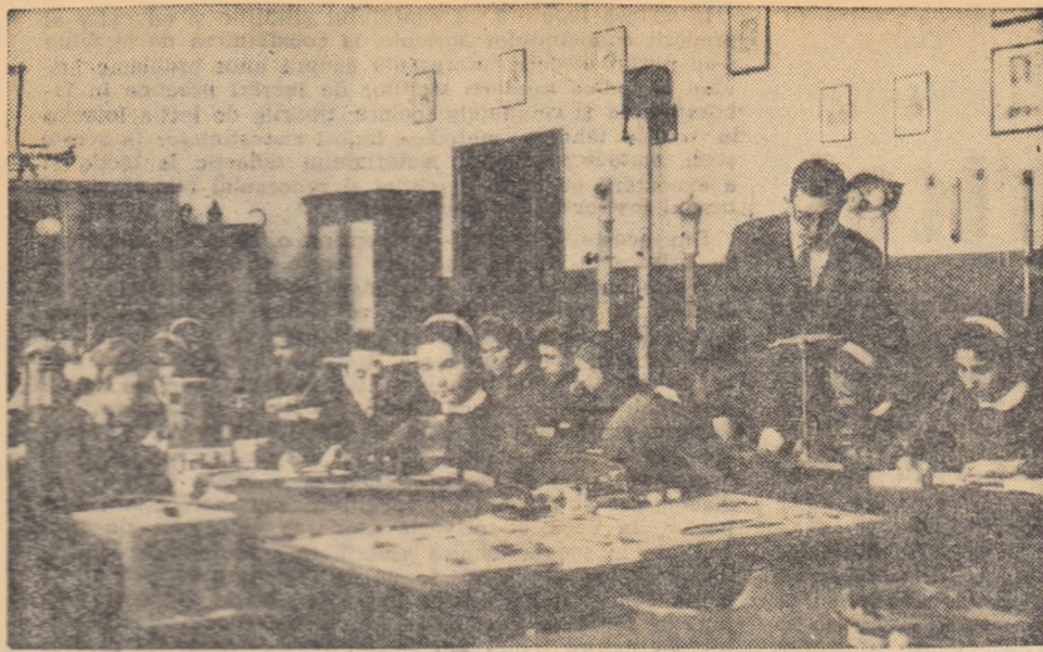
O lucrare practică interesantă — determinarea greutatei specifice a corpurilor solide — efectuată de elevii clasei a XI-a de la Școala medie nr. 1 din Giurgiu