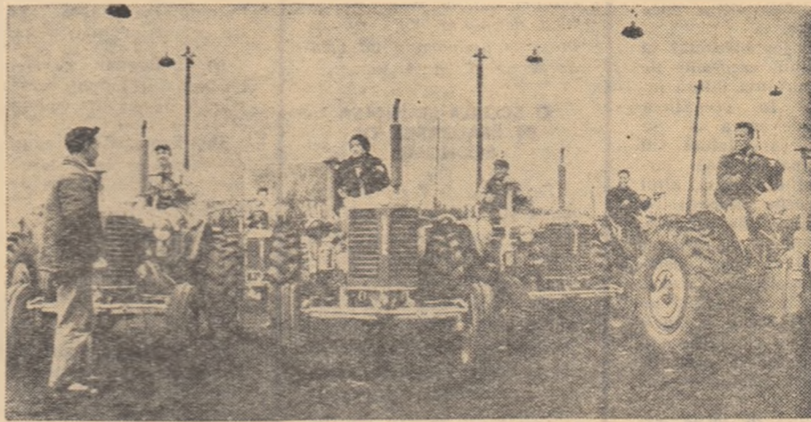
Școala de tractoriști din Șanghai pregătește cadre specializate pentru comunele populare din jurul orașului.

Sub lozincă „Fabricile înființează școli, iar școlile înființează fabrici” se desfășoară în prezent, în Republica Populară Chineză una din cele mai importante acțiuni în scopul îmbinării învățămîntului cu munca în producție.