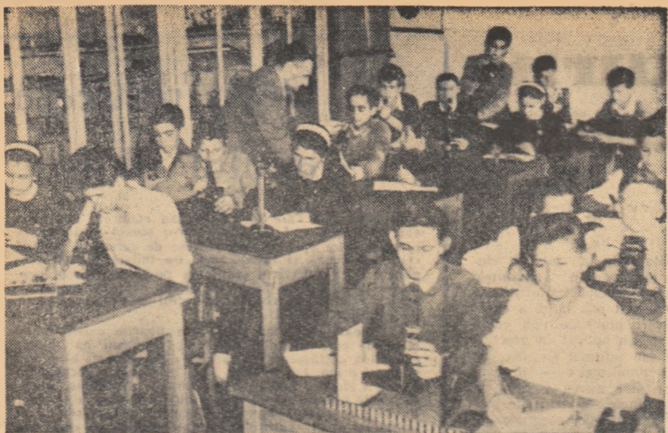
Tot mai multe școli profesionale și tehnice dispun de cabinete școlare bogat dotate. În fotografie, o lecție practică de fizică în cabinetul Grupului școlar petrol-chimie din Tirgoșiște.