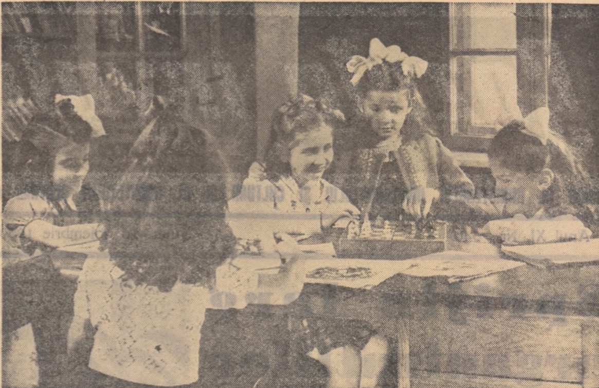
La clubul muncitorilor din învățămînt din Capitală se organizează multe activități interesante pentru copii salariaților.

Relațiile dintre școală și organizația U.T.M. sau de pionieri sint complexe, sarcinile lor se întrepătrund. De aceea, colaborarea dintre ele trebuie să se dezvolte pe calea justă a sprijinirii reciproce și a respectării independenței în activitate, pentru formarea unor tineri cu o temeinică pre-