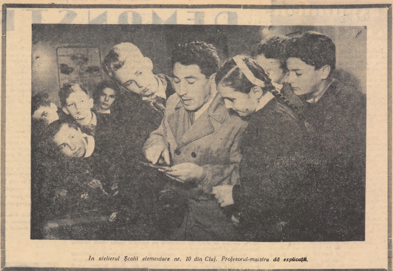
In atelierul Școlii elementare nr. 10 din Cluj. Profesorul-maistru dă explicații.