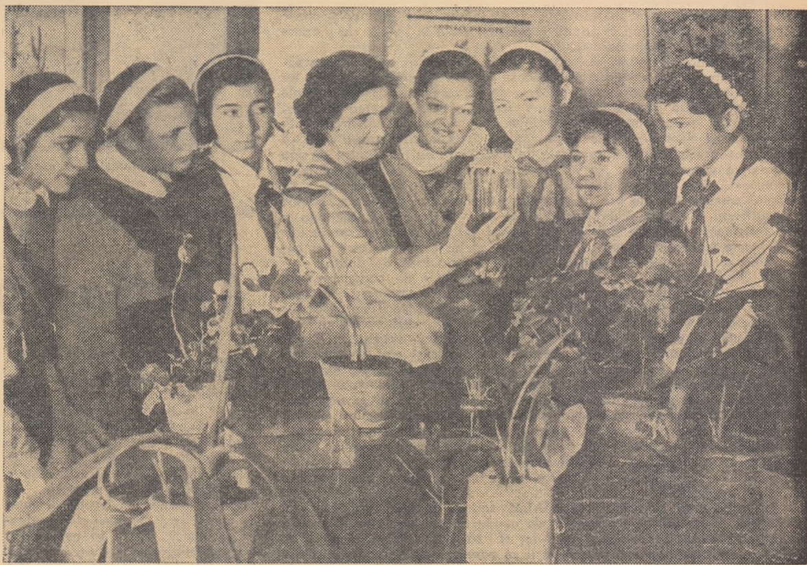
O oră de botanică la Școala de 7 ani nr. 120, din București. Lecție despre încolțirea semințelor.