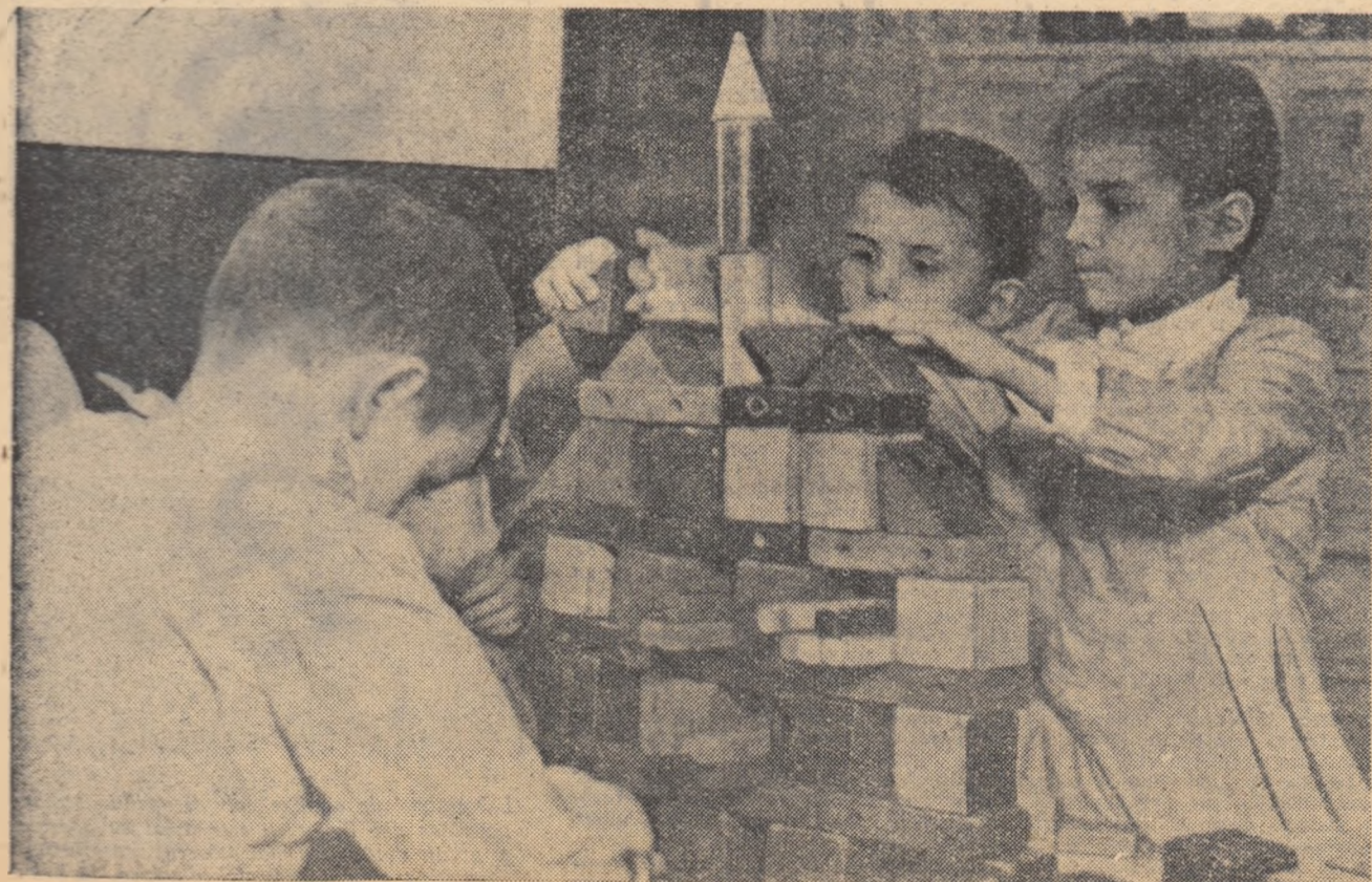
Bei mai mici dintre viitorii constructori...