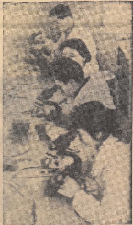
Laboratorul de analize al Grupului școlar veterinar din București este dotat cu aparate și utilaje dintre cele mai moderne, care permit efectuarea unor experiențe complexe. Iată un grup de elevi făcînd în laborator analiza la microscop a unor preparate.