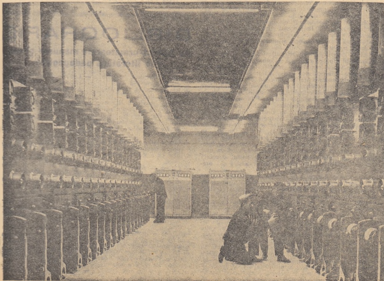
Mazinele Săvinești, Sala înfășurării firelor.

3. În economia țării noastre mai există încă unele elemente capitaliste. Sectorul capitalist, care în 1949 dădea 48,6% din producția globală industrială a țării, cuprindea 60,5% din comerț și cca. 5,5% din numărul gospodăriilor țărănești individuale, a suferit schimbări foarte mari. Creșterea an de an a sectorului socialist — de stat și cooperatist — a dus la restrîngerea concomitentă a sferei relațiilor capitaliste de exploatare. Burghezia de la orașe și chiaburimea au fost desființate ca clase. Au rămas ca elemente capitaliste, cu o greutate specifică neînsemnată în cadrul economiei naționale, unii care își asigură existența pe calea comerțului particular, însușindu-și o parte din veniturile oamenilor muncii, unii proprietari de mijloace de producție de la sate (deținători de prese de ulei, darace de lînă, gaterne, mori țărănești, piuă