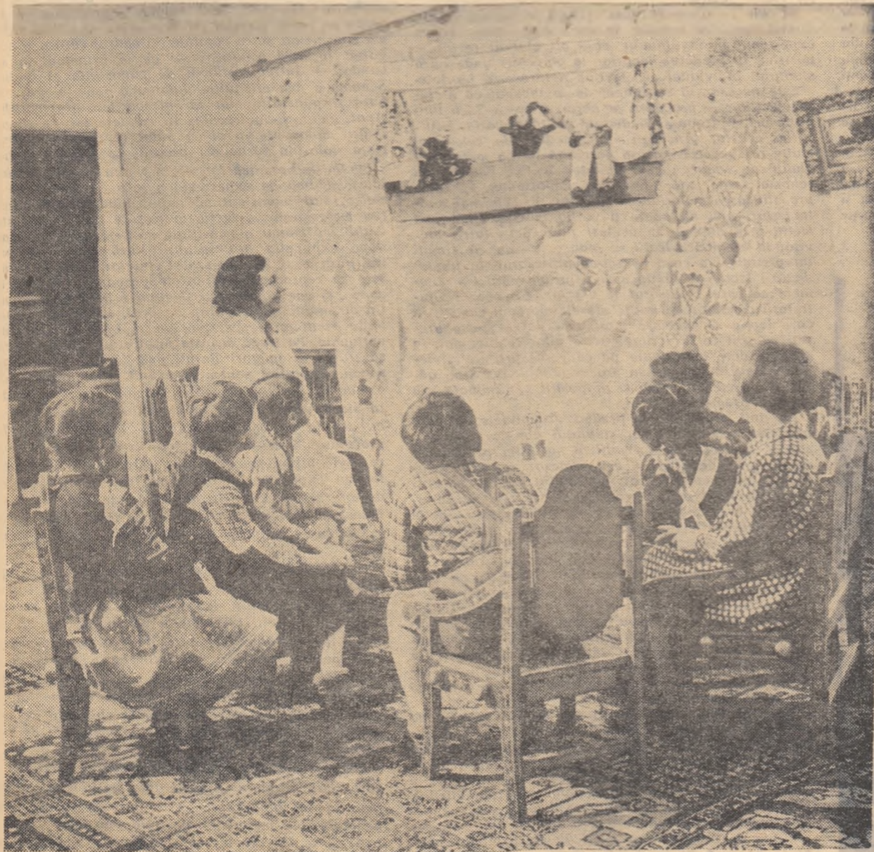
Într-o grădiniță de copii socialică: Un spectacol amuzant!

Abonamentele se primesc de către difuzorii voluntari din unitățile școlare, factorii poștali și oficiile P.T.T.R. Costul unui abonament este de 3,25 lei pe 3 luni, 6,50 lei pe 6 luni și 13 lei pe 12 luni.