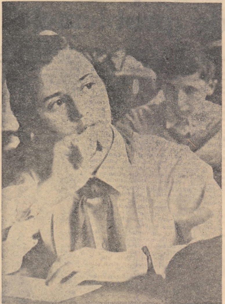
Compunere liberă. Sînt altele subiecte... Pe care să-l alegi?