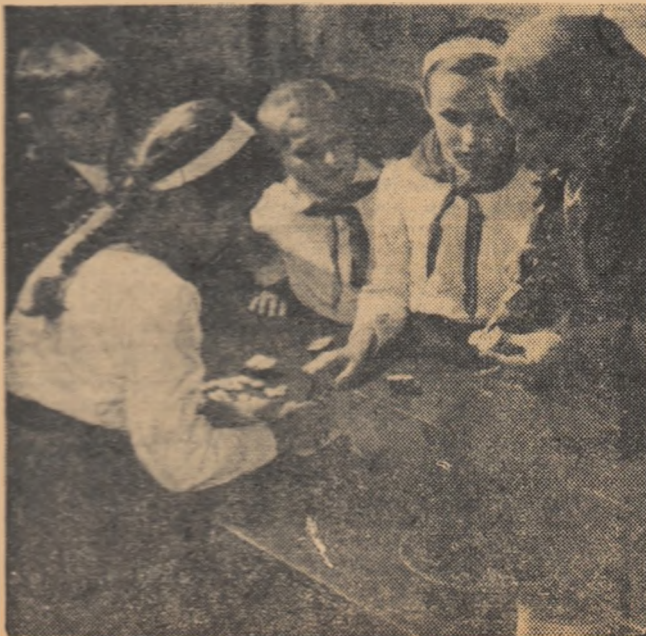
Sortarea semințelor pentru lotul școlar la Școala din comuna Stolnici, regiunea Pitești.

Nu mai vorbim de trandafirii creați de Ghedzira. În colțul trandafirilor toată vara este un adevărat rai. Pe aceeași tufă înflorește aici trandafiri în cîte 3, 4 și 5 culori, fiecare coardă dînd flori de o anumită culoare. Toți aceștia au fost altoiți pe măcieș. Ghedzira a încercat chiar să altoiască trandafir pe stejar. Experiența nu i-a reușit, dar nu s-a descurajat.