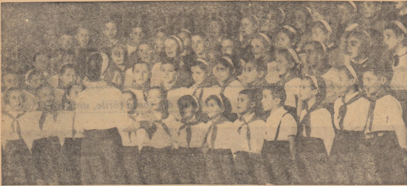
Un cădelec pentru 7 Noiembrie