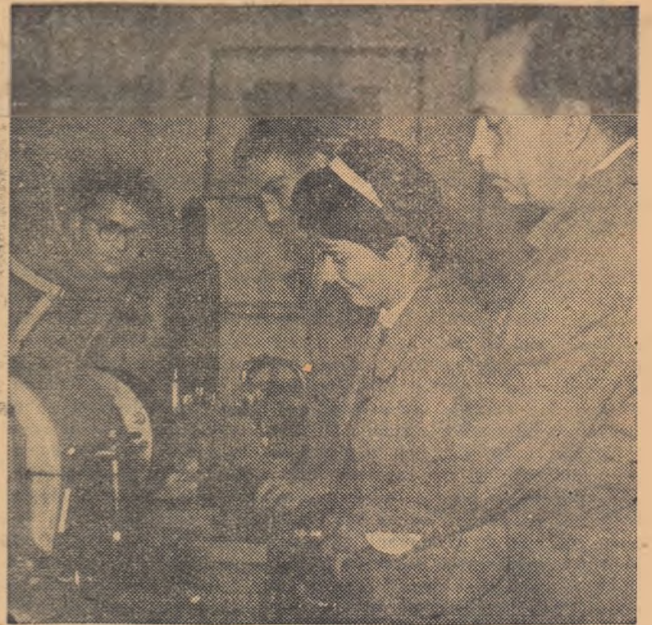
Elevii clasei a X-a a Școlii medii „I. L. Caragiale” din București învață să minuiască mașinile.