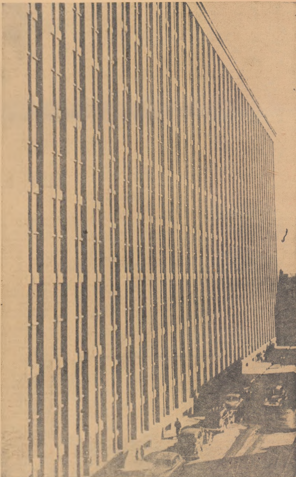
În U.R.S.S. apare în prezent o cincime din numărul total al cărților editate în întreaga lume. Fotografia noastră înfățișează Biblioteca centrală „V. I. Lenin” din Moscova. Prin fondul ei de milioane de volume, dintre care multe exemplare unice, această bibliotecă se numără printre cele mai mari din lume.