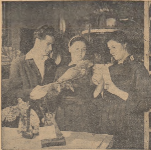
În muzeul de științe naturale al Școlii medii „D. Cantemir” din Capitală