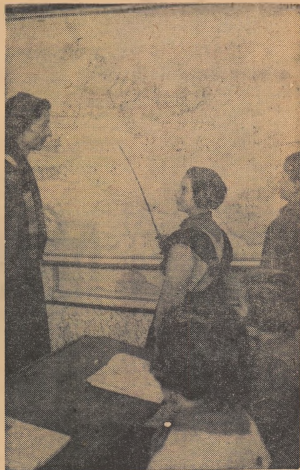
La lecțiile de istorie predate la Școala de 7 ani din comuna Lipia, raionul Buzău, se folosește des harta. În clipă: demonstrație la hartă în timpul unei lecții de istorie antică.