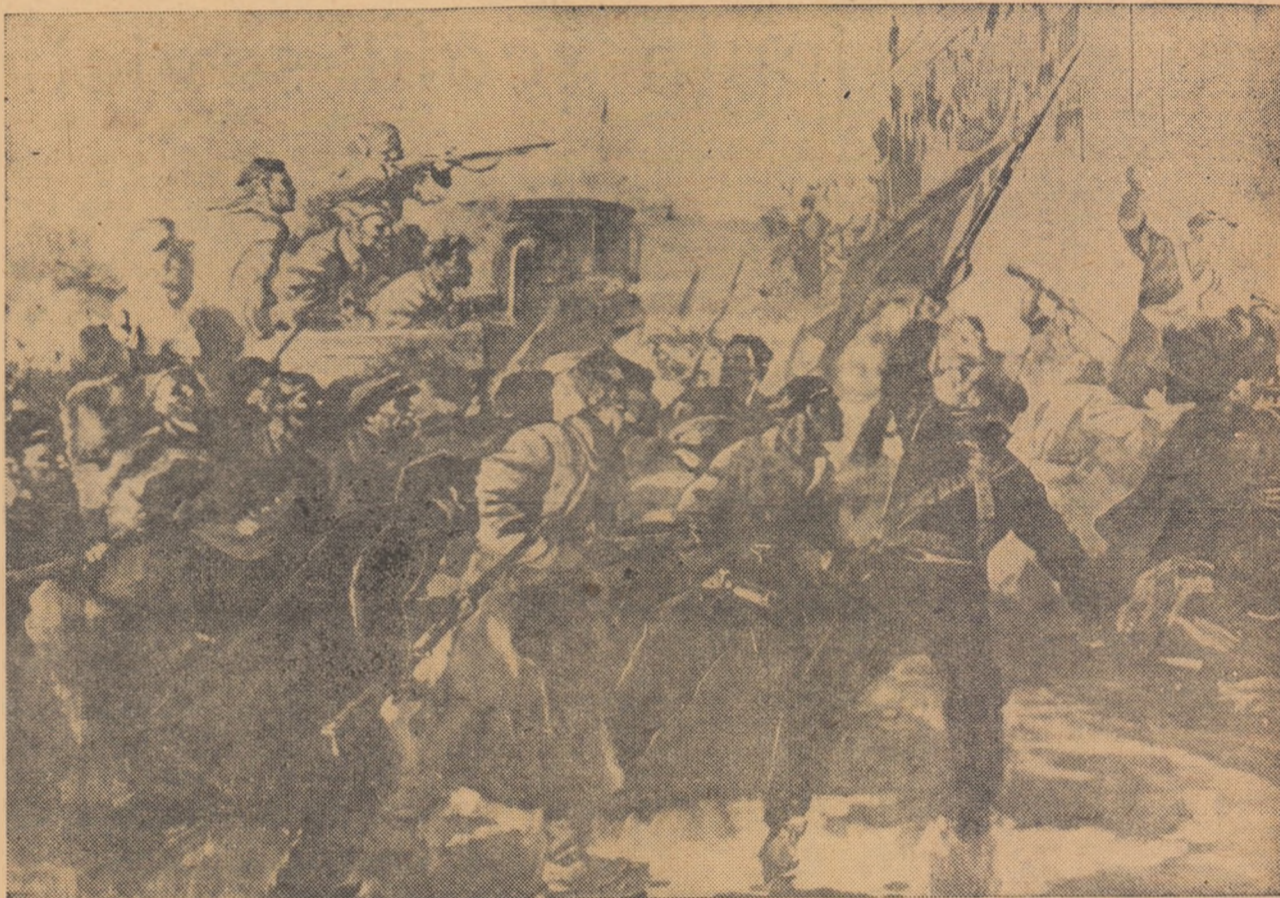
V. SEROV: Cucerirea Palatului de iarnă

Nu este întîmplător că în țara în care se dă viață visurilor celor mai avîntate ale omenirii, cultura a cuprins masele largi, că de la mic la mare, oamenii învață cu sîrg, perfecționîndu-și munca neîncetat. Noua orientare a școlii sovietice — spre prac-