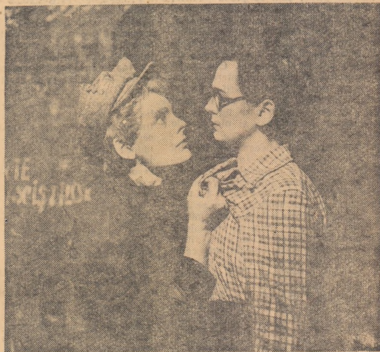
O scenă din piesa „Nila”.