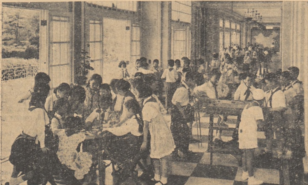
În orașele Chinei s-au ridicat palate și case ale pionierilor. După orele de școală elevii vin să participe la jocurile științifice și tehnice organizate aici. În fotografie: un colț al Palatului tineretului din Sanhai.

Multe comune populare, uzine, fabrici și mine au înființat diferite tipuri de școli serale pentru oamenii muncii din producție. Prin aplicarea liniei Partidului Comunist de îmbinare a învățămîntului cu munca productivă, aceste școli au ajuns la realizări remarcabile.