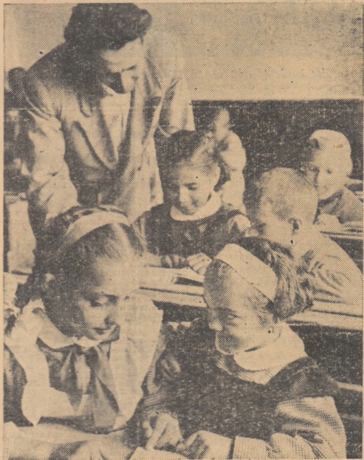
Elevii clasei a V-a de la școala de 7 ani din satul Călugăreni, raionul Vidra, au venit în vizită la cei mai mici colegi ai lor, elevii clasei I-a.