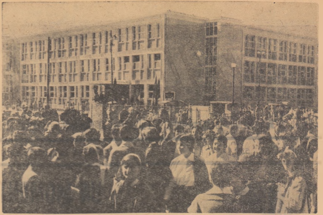
Duminică a avut loc inaugurarea noului local al școlii nr. 76 „Donca Simo” din Capitală. În diseu, în fața școlii înainte de începerea festivității