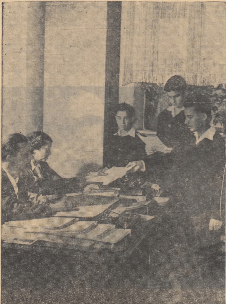
Înscrierea pentru noul an la Școala medie „Nicolae Bălcescu” din Capitală.

Să fie oare vorba aici de „cauze colective”? Se pare mai curînd că