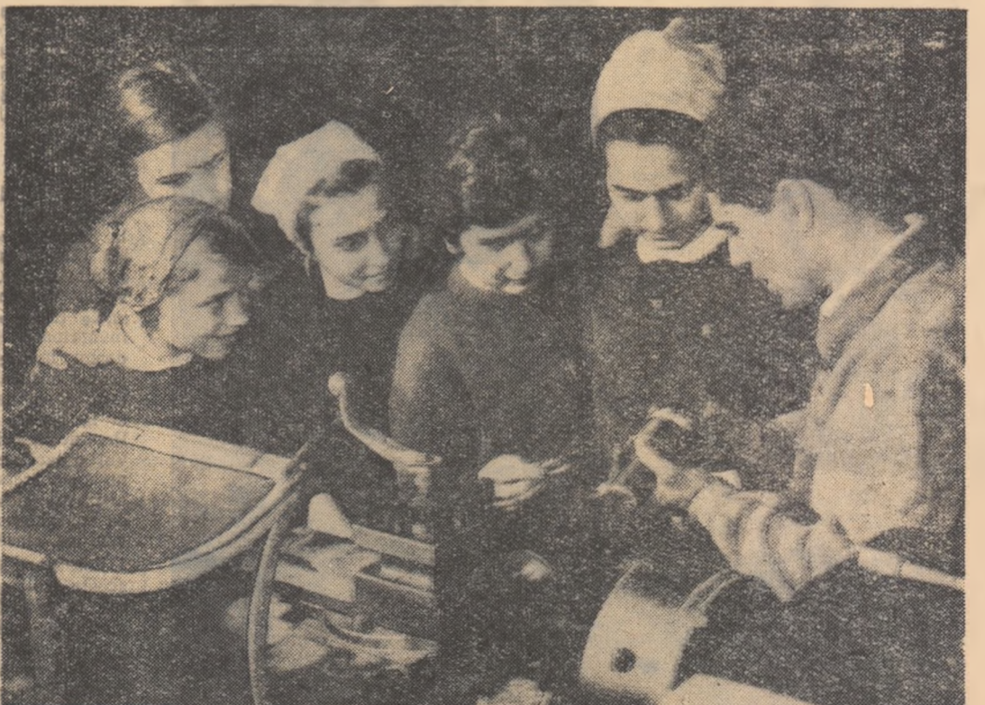
În cadrul lucrărilor practice efectuate la Atelierele C.F.R. „Grișta Roșie”, elevii Școlii medii nr. 4 „Aurel Vlaicu” au studiat construcția strungului

5. La încheierea fiecărui trimestru se va analiza munca depusă de elevi. Aceștia vor fi notați — ca la orice altă disciplină — conform cunoștințelor practice și teoretice dobîndite.