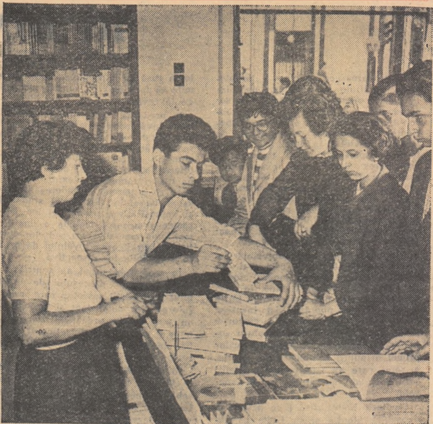
Zilele acestea din pragul noului an școlar au adus în librării un mare număr de cumpărători: sînt elevi din toate clasele, nerăbdători să răsfoiască paginile manualelor, să afle de pe acum cite ceva despre toate cite vor învăța în cursul anului.

Pregătindu-se cu minuțiozitate pentru începerea unei noi etape de muncă, profesorii și elevii Grupului școlar „Iosif Rangheț” se străduiesc să asigure toate condițiile necesare pentru ca steagul de școală fruntașă, cîștigat anul trecut prin munca întregului colectiv să fie reținut în școală și în acest an.