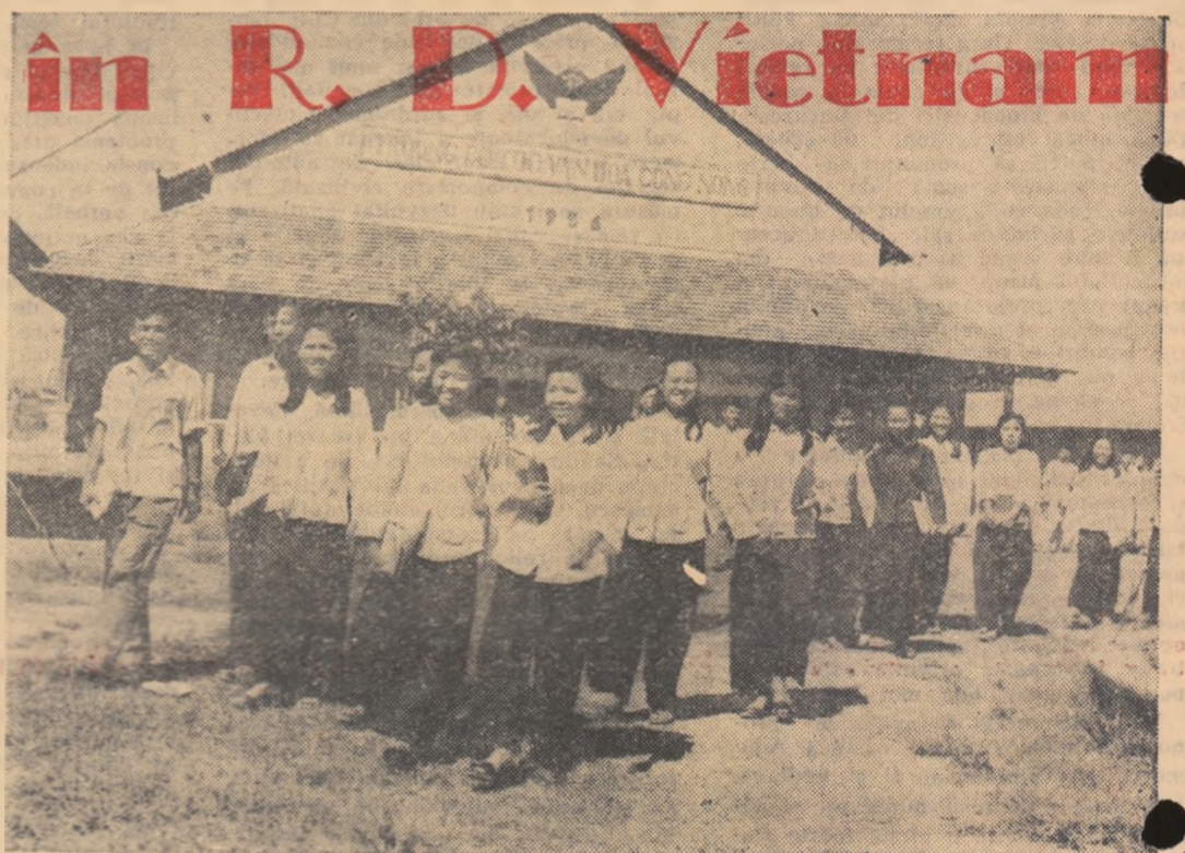
Elevii unei școli de perfecționare a culturii generale.

Acum, la 14 ani de la proclamarea Republicii Democratice Vietnam, poporul vietnamez se mîndrește cu mari realizări în toate domeniile. Anul școlar care s-a încheiat a fost primul an de luptă pentru realizarea învățămîntului socialist. Este greu, desigur, să treci în revistă toate rezultatele atât de variate înregistrate în decursul acestui an de eforturi, de luptă împotriva numeroaselor greutăți pe care le prezintă o muncă nouă. Totuși, pentru a le constata, ajunge să-ți arunci privirea asupra aspectului unei școli, să răsfoiești caietele unui elev, să vizitezi atelierele de producție sau orezăriile cultivate de elevi. Toate acestea sînt realizări noi, create conform principiului îmbinării muncii școlare cu munca productivă. Dar rezultatul cel mai convingător îl constituie elevii înșiși care, în marea lor majoritate, au încheiat anul școlar cu mari succese. Fiecare din cei 1.117.569 de elevi ai Vietnamului de Nord, fie că este în clasa a III-a, în clasa a V-a sau în clasa a X-a, poate să ilustreze rezultatele primului an de învățămînt socialist.