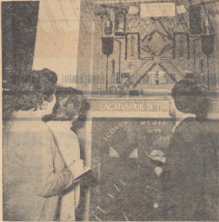
Vizitatorii privesc cu interes exponatele care oglindesc legarea învățămîntului de practică

DE LA MINISTERUL INVĂȚĂMÎNTULUI ȘI CULTURII