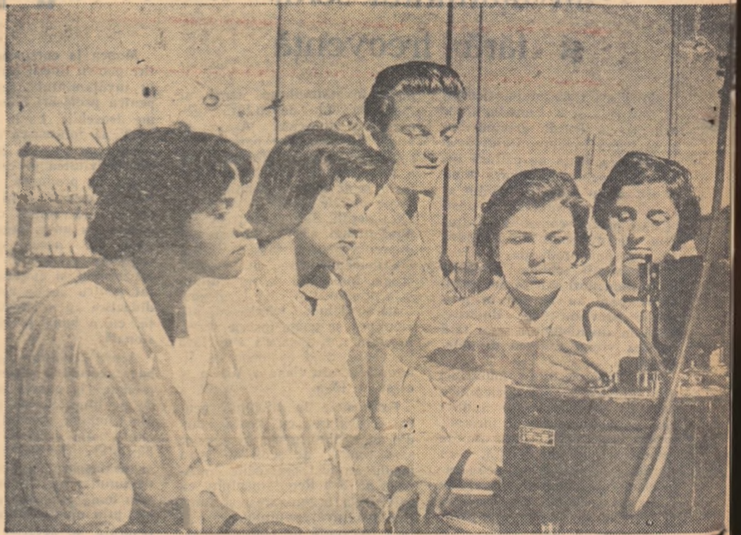
În cadrul cercului lor de științe naturale, ale căror lucrări se desfășoară la Institutul agronomic din Capitală, medii nr. 22 urmărească, sub îndrumarea cercetătorilor institutului, probleme fiziologice legate de cultura...