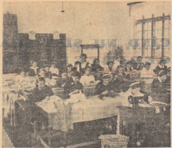
Planul de producție al atelierelor Școlii de meserii din Pitești cuprinde un bogat sortiment de produse de larg consum. Pe lângă numeroase componente de mobilier, destinat școlilor și căminelor culturale, se execută acî și un mare număr de confecții pentru femei și copii. Aceste produse sînt mult apreciate în întregile regiune.

În ilustrație: un aspect din munca practică a elevilor în atelierul de confecții al școlii.