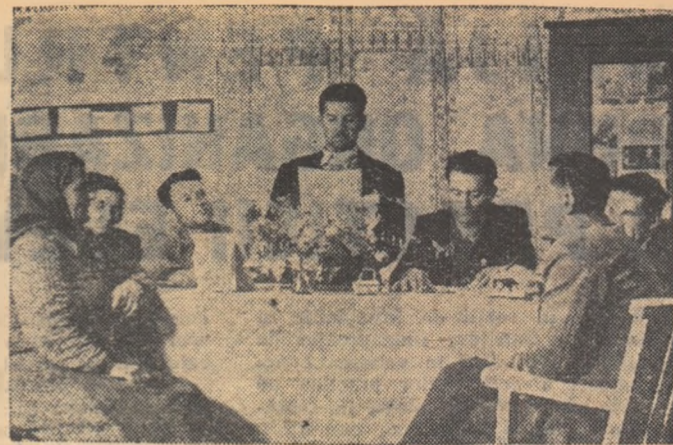
— La ordinea de zi un singur punct: construirea unei clădiri noi pentru școala din comună. (În eligeu: membrii Comitetului executiv al Statului popular din comuna Căișeni, raionul Căișeni, discutând măsurile care trebuie luate pentru începerea lucrărilor de construcție a noii școli.)