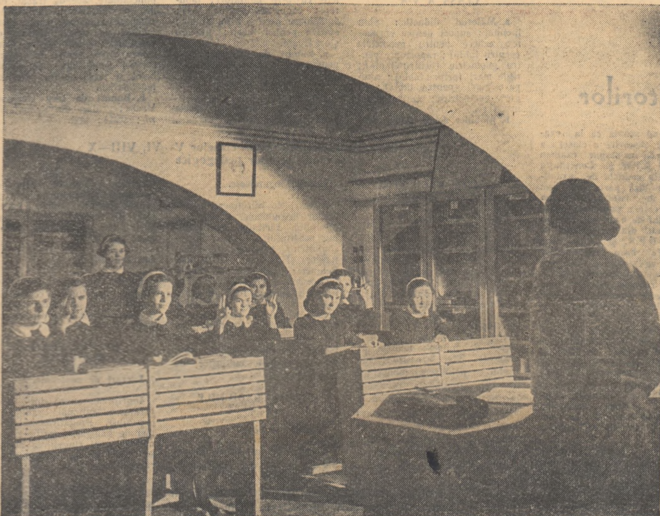
Elevii clasei a X-a de la Școala medie nr. 10 din București în timpul unei ore de recapitulare în cabinetul de matematică al școlii