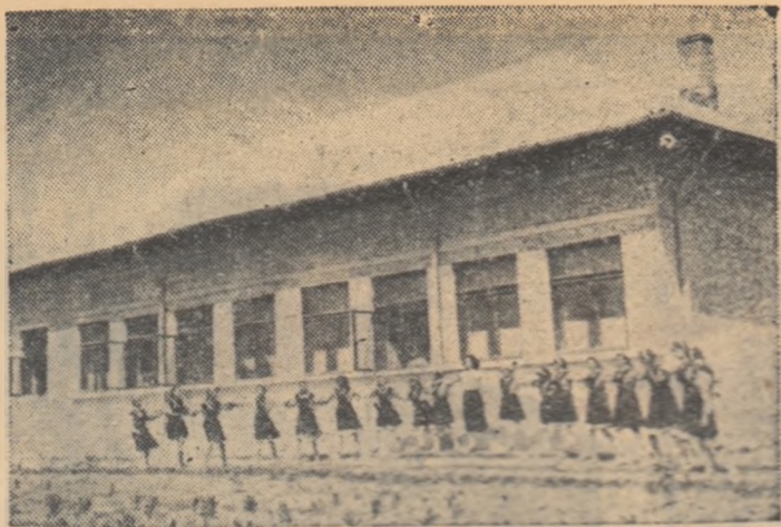
În cursul acestui an școlar a fost dată în folosință noua clădire a Școlii elementare de 7 ani din comuna Căișeni.