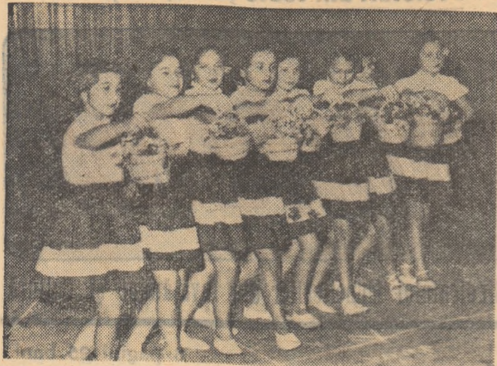
Elevii claselor a III-a și a VI-a, de la Școala de 7 ani nr. 172 din București au prezentat de curind un frumos program artistic. În clipă: un moment din „Dansul coșulețelor cu flori”.