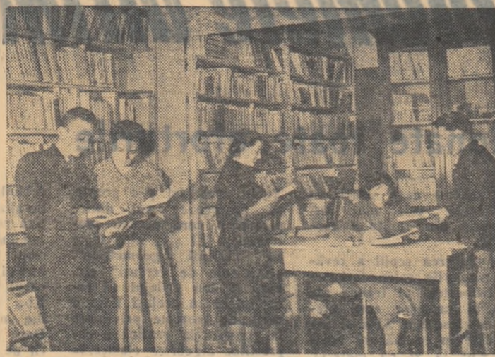
Centrul școlar agricol și zootehnic nr. 1 din Turda este unul dintre cele mai mari centre de acest fel din țară. În cele 4 școli care funcționează în cadrul grupului — două de mecanici și două de maștri — se pregătesc cadre specializate pentru sectorul socialist al agriculturii. Elevii grupului școlar au la dispoziție un internat cu dormitoare spațioase, o bibliotecă cu peste 5.000 de volume (lucrări de specialitate și literatură), o cantină pentru 160 de persoane etc. În colțul: Biblioteca Centrului școlar agricol nr. 1 din Turda.