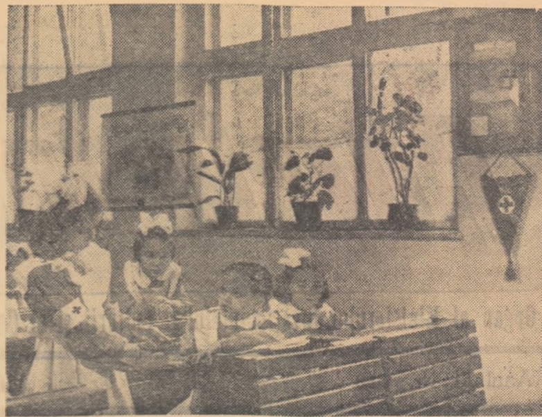
Ținuta elevilor, ordinea și curătenia care domnesc în această clasă a Școlii de 7 ani nr. 40 din Capitală arată că postul sanitar de aici merită cu adevărat steagul de colț sanitar fruntaș.