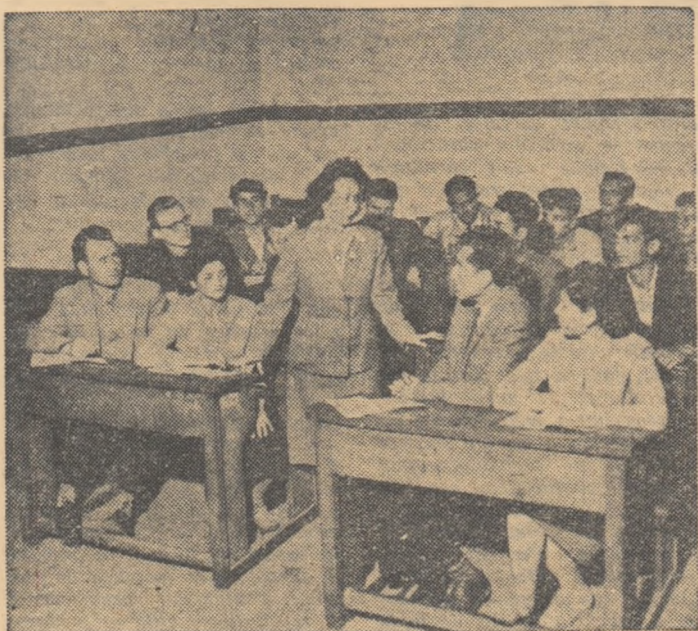
Cu o deosebită atenție ascultă tinerii muncitori explicațiile pe care le primește la cursul de pregătire, în vederea intrării în clasa a VIII-a a școlii serale.

Muncitorii din industrie și agricultură absolvenți ai școlilor profesionale sau agricole cu durata de 1-2 ani, care au absolvit școala de 7 ani și dorec să urmeze învățămîntul mediu trebuie să-și completeze mai întîi studiile claselor V, VI și VII elementare, prin învățămîntul fără frecvență. Elevii care au promovat anul I al unei școli profesionale sau agricole se pot înscrie în clasa a VI-a elementară, iar cei care au promovat anul II al unei școli profesionale sau agricole, în clasa a VII-a. Elevii care au promovat anul III al unei școli profesionale cu durata de 4 ani se înscriu în clasa a VII-a.