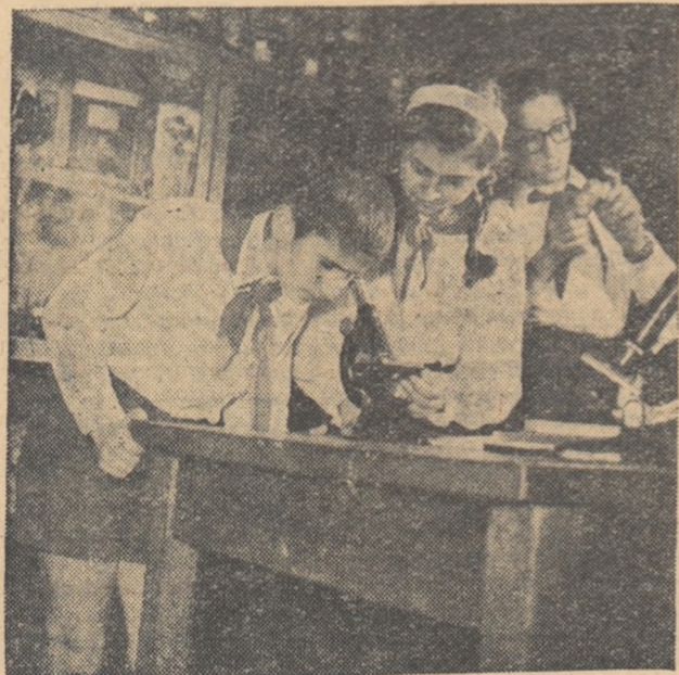
În laborator, la ora de lucrări practice.