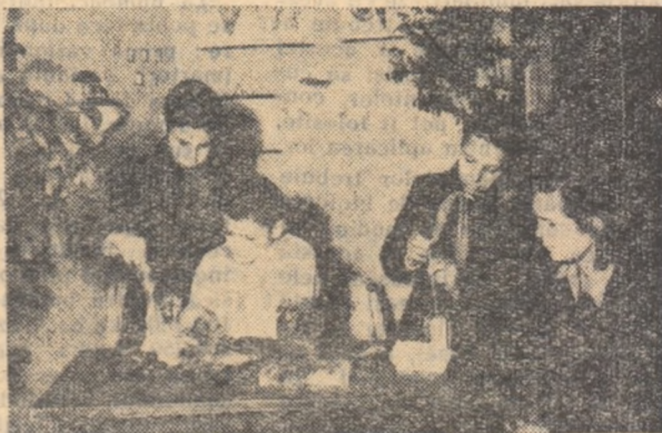
Iată în prima fotografie două dintre pionierii grupei de botaniști de la Palat, însemnînd în jurnalul grupei rezultatele probei de germinare a orezului.