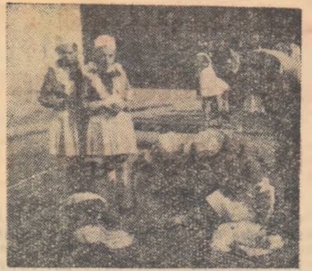
De curînd s-au desfășurat în întreaga țară concursurile posturilor sanitare școlare. În fotografie, un aspect de la concursul desfășurat în raionul Lipova: colectivul postului sanitar al Școlii din Ghiroc la proba practică de prim ajutor.

secretar al organizației de partid de la Școala medie „D. Cantemir” București