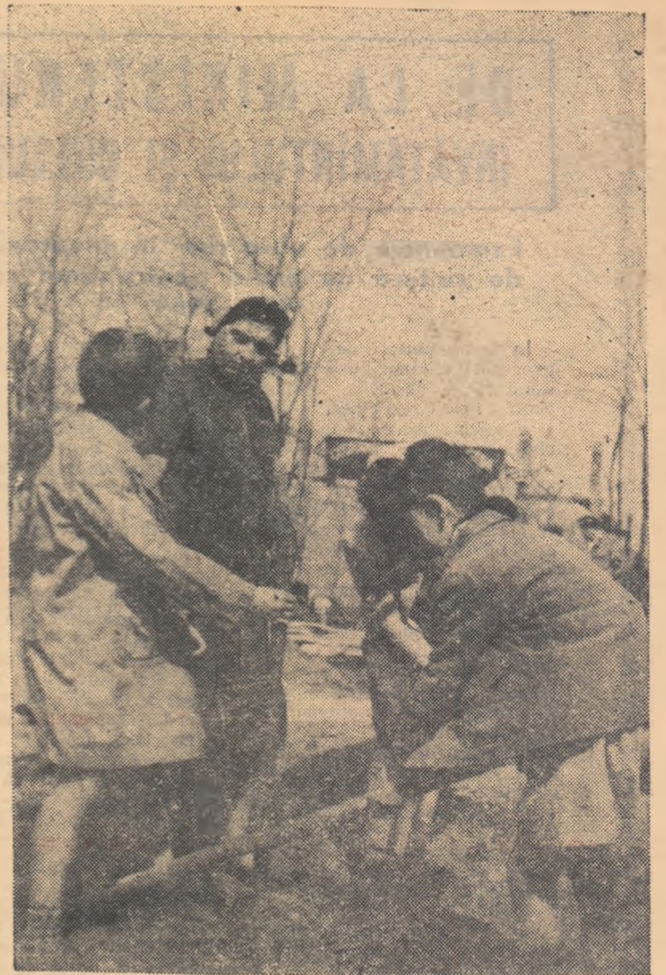
Peste ani, pomii sădiți astăzi de elevii din București și din comuna Rica, raionul Costești, vor da rod bogat.