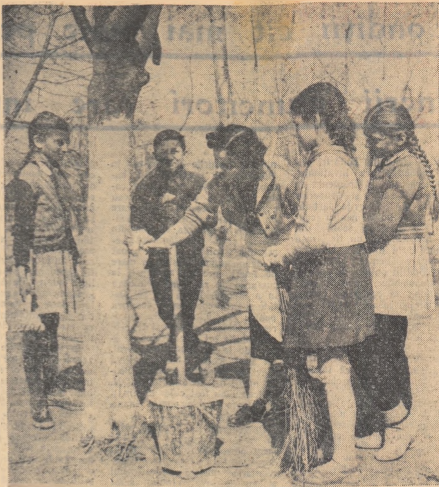
Pionierii și școlarii de la Școala de 4 ani din satul Mărginenii de Sus, comuna Dărmănești, raionul Ploiești, participă intens la lucrările practice agricole de primăvară. Iată o parte dintre ei efectuînd, sub îndrumarea învățătoarei, vîrșirea pomilor.

Discuțiile purtate în consfătuire s-au oprit însă și asupra aspectelor negative legate de predarea cunoștințelor agricole. A reieșit astfel că o lipsă principală întîlnită la unele școli constă în faptul că orele de cunoștințe agricole au fost repartizate unor cadre necalificate sau unor profesori a căror specialitate nu are nici o tangență cu agricultura, deși în școlile respective se aflau profesori de științe naturale care puteau să predea lecțiile de cunoștințe agricole în condiții mult mai bune. Repartizarea orelor la întîmplare de către unii conducători de școli denotă că ei subestimează însemnătatea pregătirii agricole a elevilor. S-a arătat, de aseme-