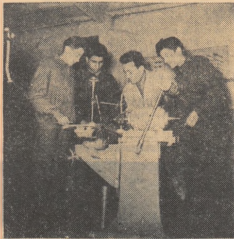
Mașina orizontală de găurit lemnul, realizată în atelierele Școlii de meserii din Craiova.

În atelierul de țimplărie al Școlii de meserii din Craiova se execută numeroase comenzi de mobilier destinat școlilor și instituțiilor de învățămînt superior.