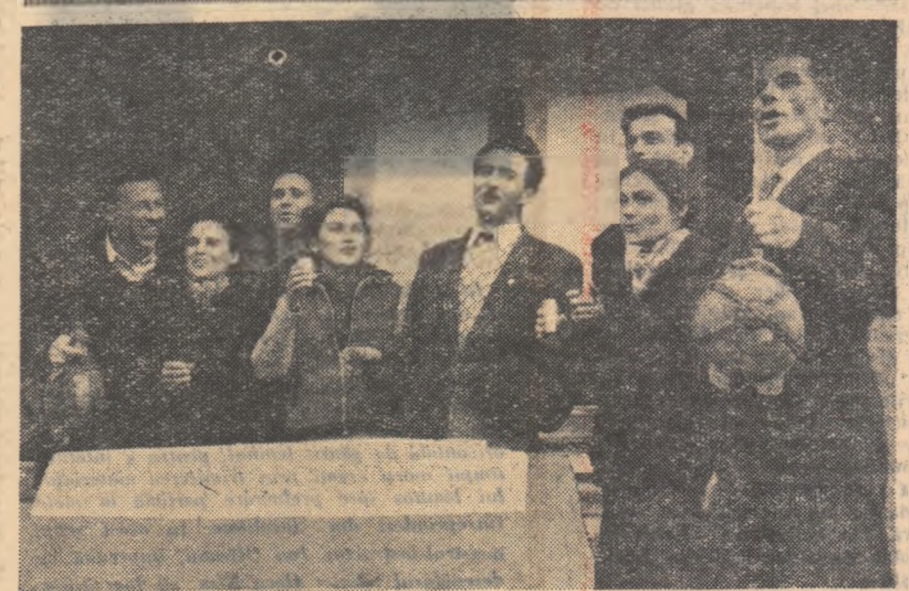
Brigada artistică de agitație a cîminului cultural din comuna Uliești, raionul Găești, regiunea Pitești, cuprinde majoritatea cadrelor didactice din localitate. Programele brigăzii sînt densebit de apreciate de țărani muncitori.

directorul Clubului muncitorilor din învățămînt din București.