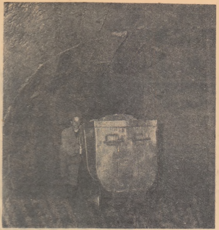
La minea din Săsar sînt desfășoară activitatea practică sute de tineri români și maghiari, ucenici și elevi ai grupului școlar din localitate. De buna lor instruire se preocupă deosebită cadrele didactice ale școlii, maistrii și muncitorii din mină.

Între comisiile pentru îndrumarea și controlul practicii din diferite întreprinderi s-a creat o adevărată emulație pentru obținerea celor mai bune rezultate