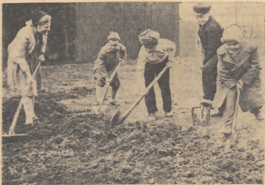
Elevii Școlii de 7 ani nr. 179 din București pregătesc terenul agricol pentru însămînțări.