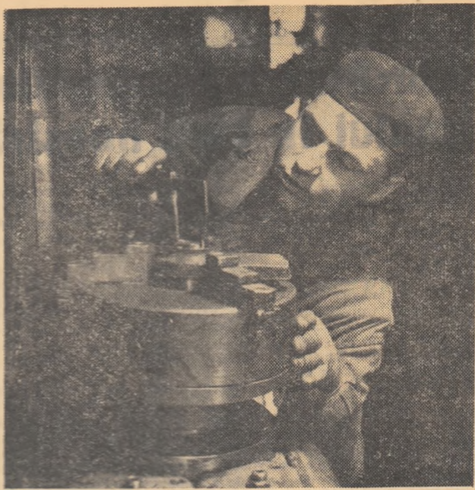
Lucrările de control pentru încheierea trimestrului II sînt pentru ucenici o serioasă verificare a cunoștințelor și deprinderilor însușite.