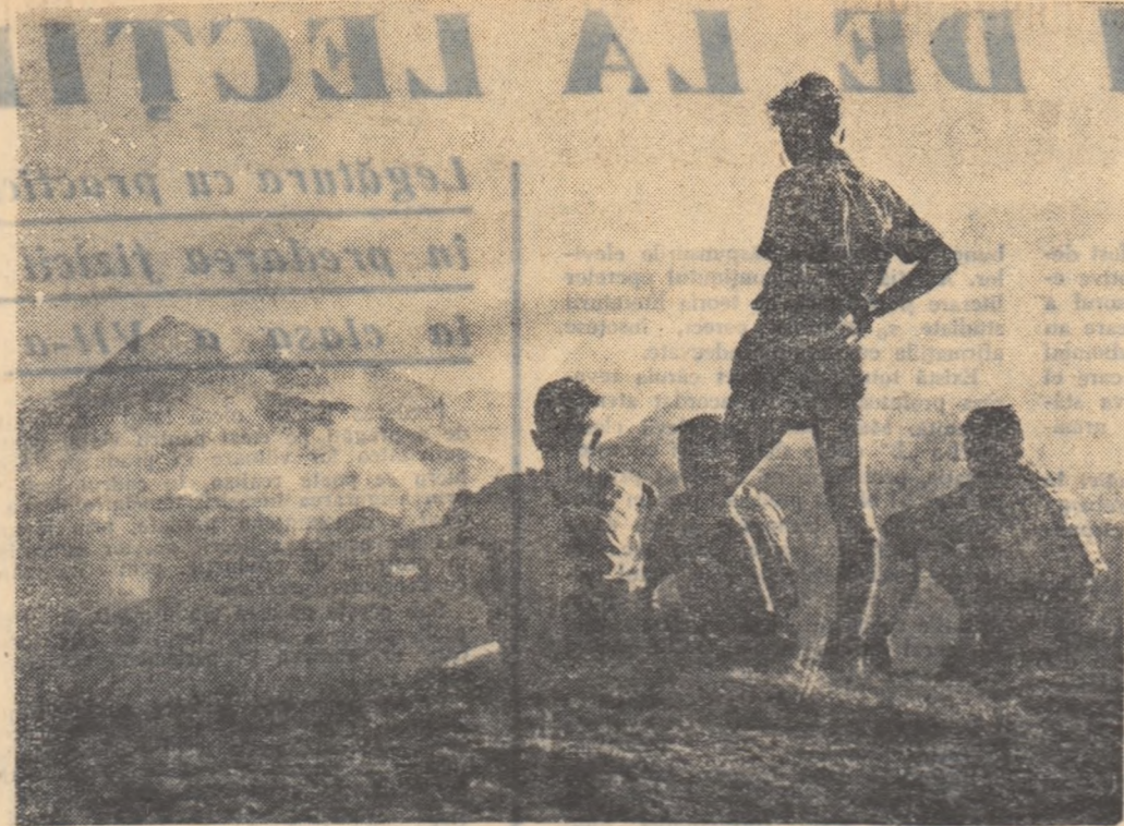
Excursie în munții Făgărașului. Școlarii admiră frumusețea peisajului.