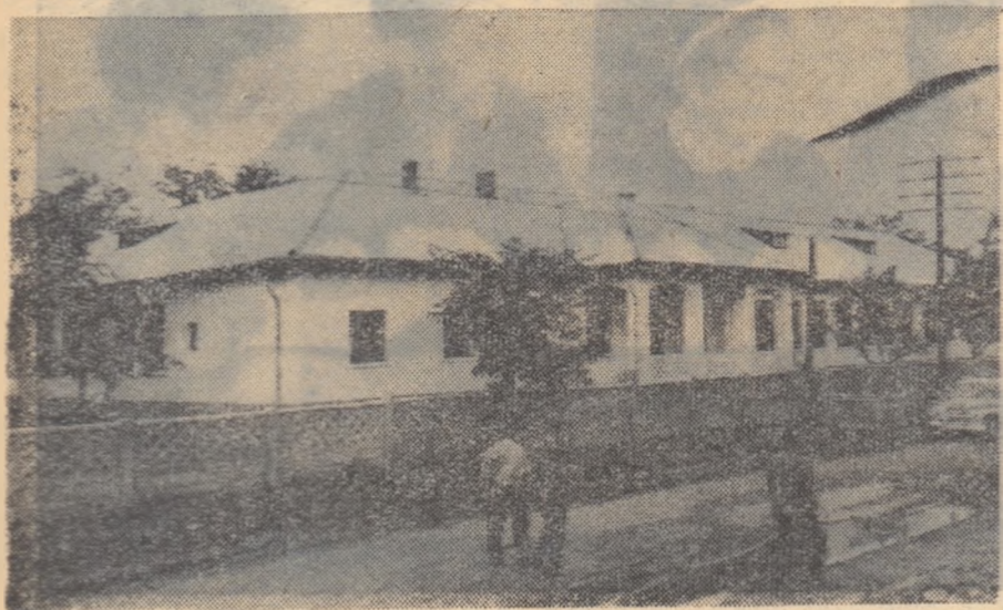
Noul local al Școlii medii din Moinești