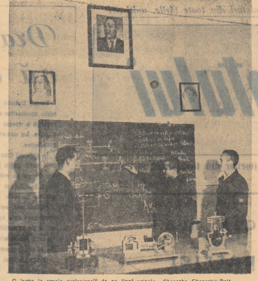
O lecție la școala profesională de pe lângă uzina „Gheorghe Gheorghiu-Dej” din Tirgoviste.