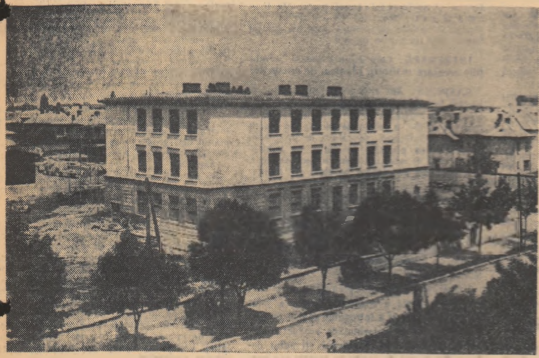
Pe staga blocurile de locuințe, pe Șoseaua Încălzirii din București, s-a construit și un bloc nou de școli.

Organ al Ministerului Învățămîntului și Culturii și al Comitetului Central al Sindicatului Muncitorilor din Învățămînt și Cultura Anul X, Nr. 497 Vineri 19 decembrie 1958 4 pagini 25 bani