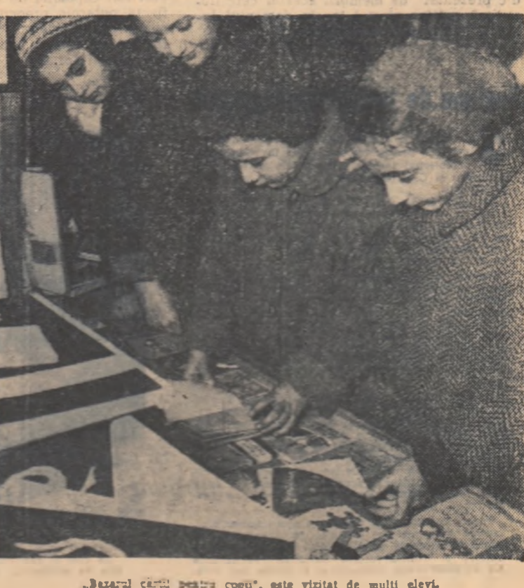
„Baza” cărții pentru copii, este vizitat de mulți elevi.