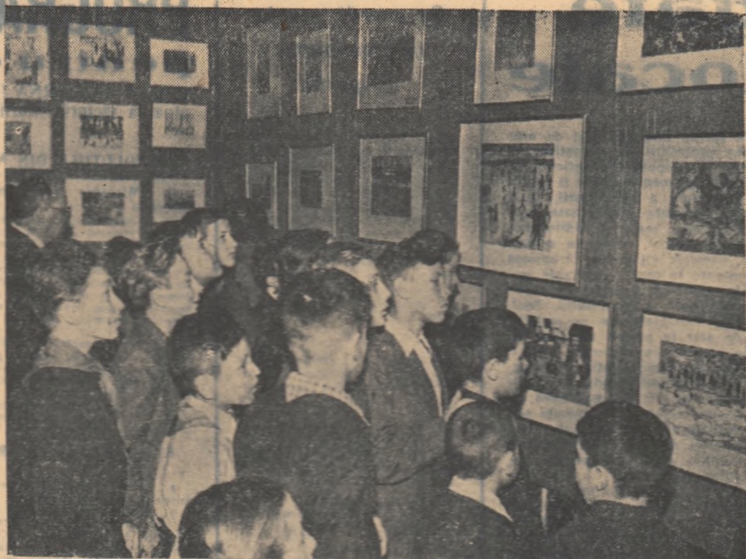
La Moscova s-a deschis cea de-a XX-lea expoziție națională a creației plastice a copiilor. În clase: școlarii vizitând expoziția.