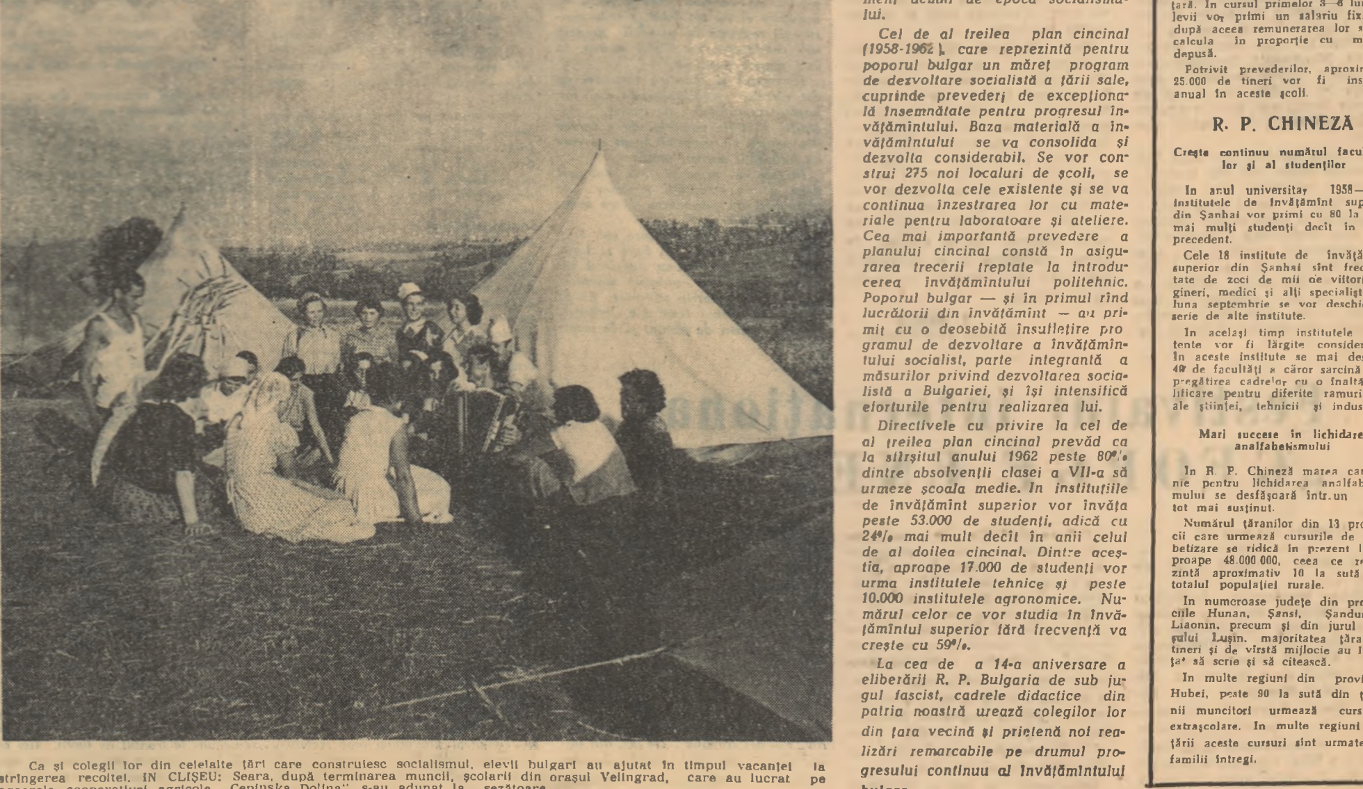
Ca și colegii lor din celelalte țări care construiesc socialismul, elevii bulgari au ajutat în timpul vacanței la strîngerea recoltelor. În CLISEU: Seara, după terminarea muncii școlare, din orașul Velingrad, s-au adunat la ogorașele cooperative agricole „Cepinska Dolina”, s-au adunat la sezoare.

Într-un bun al poporului, Porțile școlilor de toate gradele au fost larg deschise pentru fiul celor ce muncesc. Una dintre marile înfăptuiri ale politicii școlare a Partidului Comunist este generalizarea învățământului de 7 ani, fapt care a creat condiții pentru ridicarea nivelului cultural al întregului popor.