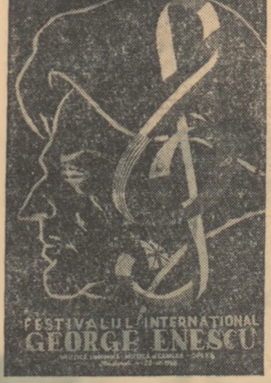
observăm că muzica lui Enescu, izvoată din cîntecul popular, este iubită și prețuită de aceia pentru care a fost scrisă.

Poate că, fiind prea aproape de evenimentul festivalului, să nu putem deocădată aprecia cu suficiență juste semnificația deosebită a acestui grandios spectacol ce se desfășoară sub ochii noștri. Știm însă cu siguranță că în istoria muzicii românești se scriu acum pagini pe care nu le-am întîlnit vreodată în trecut. Ne dăm seama că prestigiul artei noastre a crescut în anii de după eliberare atît de vertiginoși încît ne putem amintea cu organce altă țară cu veche tradiție muzicală. Înțelegem ca o deplină maturitate uriașă contribuție a lui George Enescu la dezvoltarea creației contemporane. Și, în sfîrșit, nu putem să nu