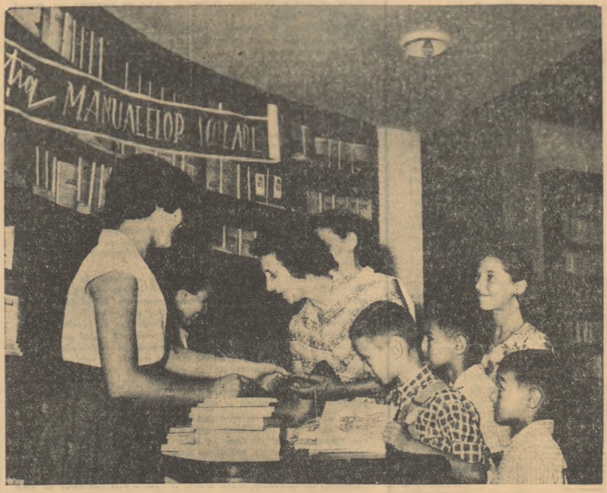
Noile manuale, tipărite anul acesta, sînt cerute cu interes de elevi.

Mașini și tehnici care pînă la redeschiderea cursurilor. În ultimul timp, pregătirea în vederea acestei mari sărbători școlare, așteptată cu nerăbdare de cadrele didactice, de elevi și părinți, s-au intensificat. Anul școlar se deschide în condițiile unor sarcini ce decurg din hotărârile partidului și guvernului pentru continuarea dezvoltării și întărirea învățămîntului nostru. Este necesară, în continuare, luarea de măsuri pentru îmbunătățirea conținutului învățămîntului pe linia tratată de partid și guvern în conformitate cu hotărârile Congresului al II-lea al P.M.R. Desigur, noi sarcini puse în fața cadrelor didactice măsuri ca trecerea la generalizarea învățămîntului de 7 ani în toate localitățile din mediul rural care au școli de 7 ani, introducerea în planurile de învățămînt a unor noi obiecte (economia politică, științele agricole), dezvoltarea învățămîntului agricol și profesional etc.