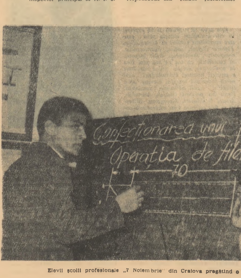
Elevii școlii profesionale „Nolembrie” din Craiova pregătind o lucrare practică.

În toată perioada practicii, ucenicii școlii profesionale de pe lângă uzinele „Klement Gottwald” au simțit marea utilitate a graficului de rotație. Lucrînd după el, ei au învățat să muncească disciplinat. Cu ajutorul graficului s-au putut realiza de asemenea, cu multă ușurință, controlul instruirii practice a ucenicilor de către maistrii-instrucători, alți și controlul activității depuse de maistrii-instrucători. Aprecînd utilitatea graficului de rotație, conducerea școlii profesionale de pe lângă uzinele „Klement Gottwald” a luat hotărîrea ca acest grafic să fie utilizat și în practica continuă, pe care ucenicii o efectuează în permanență în întreprindere.