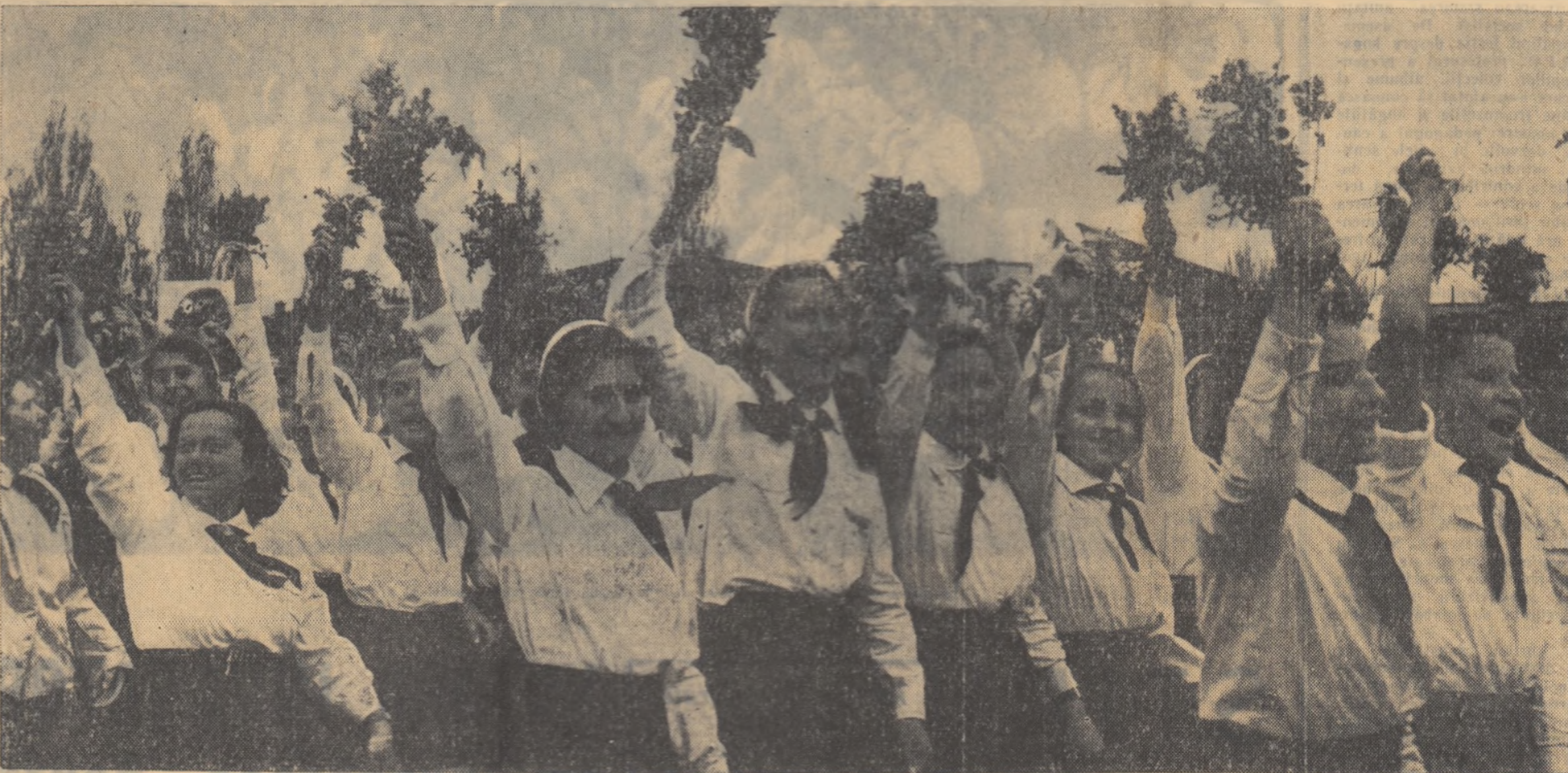
Filă de studiu a școlii comuniste la 1 Mai