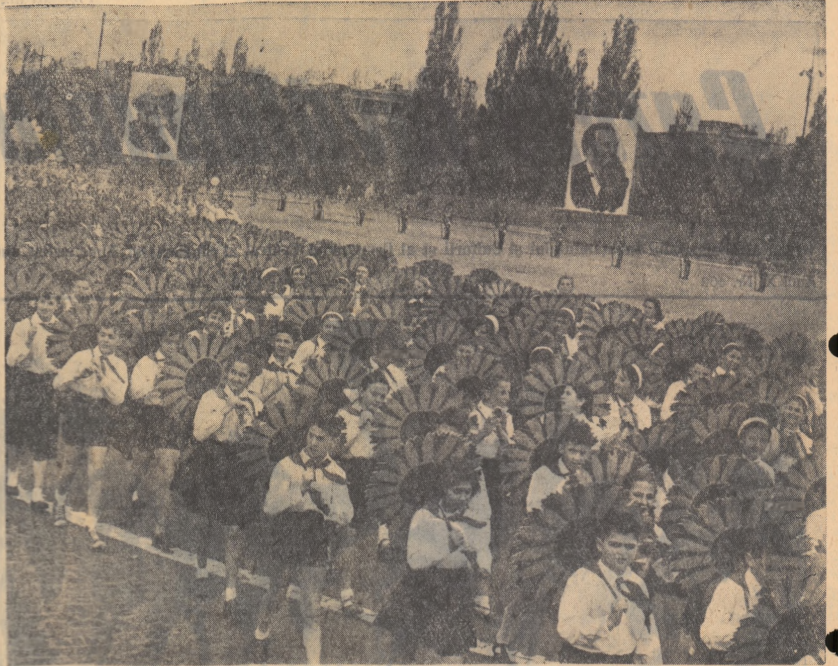
La marea demonstrație a oamenilor muncii. Copiii, florile vieții, simbol al primăverii.