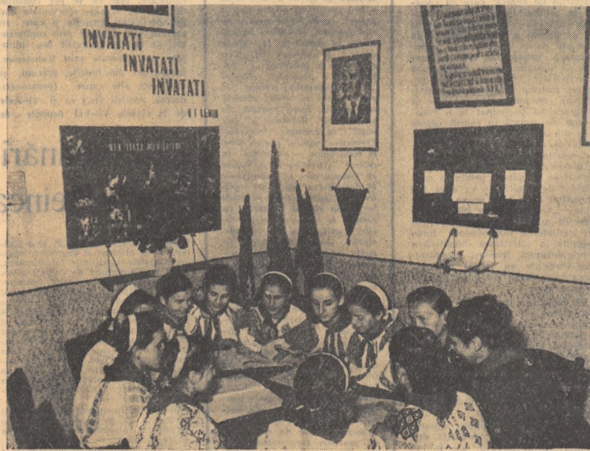
ȘEDINȚA COLECTIVULUI DE CONDUCERE AL DETAȘAMENTULUI discută felul cum se pregătesc pentru lecții pionierii școlii elementare din comuna Comani, raionul Drăgănești.