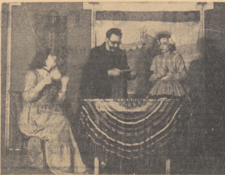
Scenă din piesa „Millo director”, interpretată de echipa de teatru a comitetului sindical al muncitorilor din învățământ. În cadrul celui de al IV-lea concurs al maijilor artistice de amatori organizat de C.C.S.