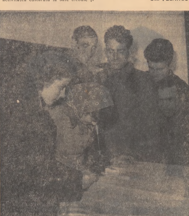
Examinarea devine mai interesantă cînd privești prin microscop