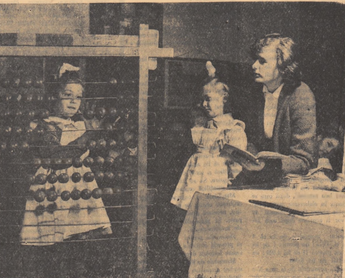
Ca interesantă este lecția de aritmetică atunci cînd se lucrează cu imagini de socotiri!