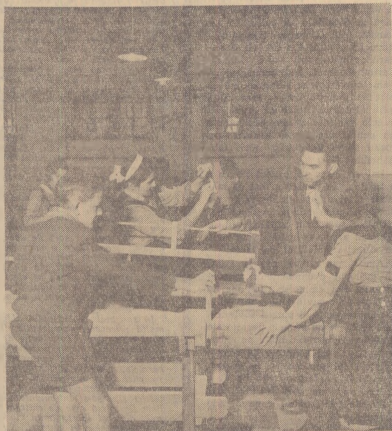
Lucrînd în atelierele care s-au înființat pe lângă școli, elevii își însușesc numeroase deprinderi practice, aplicînd cele învățate la lecții și pregătindu-se astfel mai bine pentru viitoarea lor muncă în producție.

În clasa: în atelierul de timpărie al școlii medii mixte nr. 1 lae Bălcescu” din Capitală.