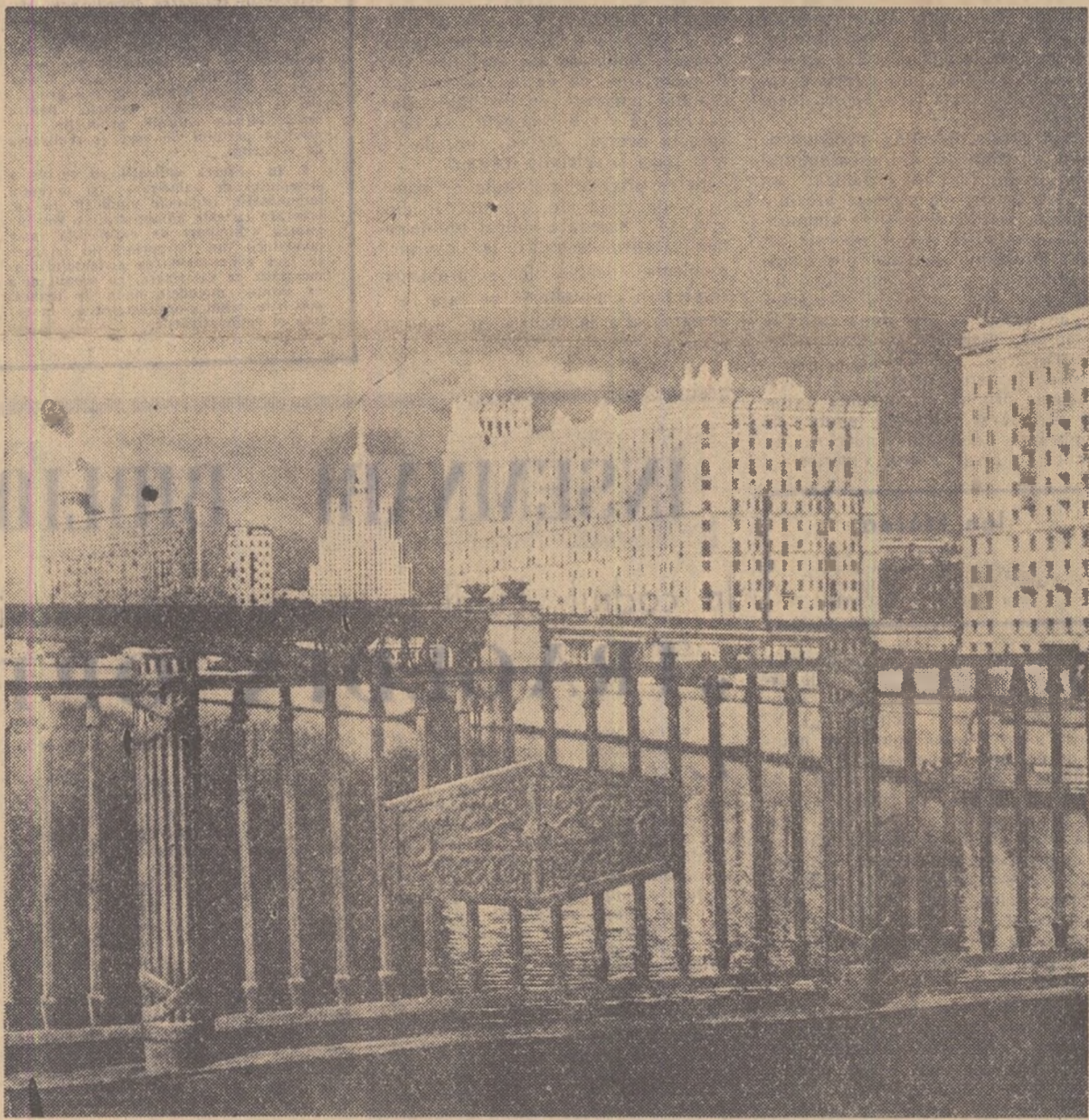
mUSCOVA, vedere de pe podul Borodino