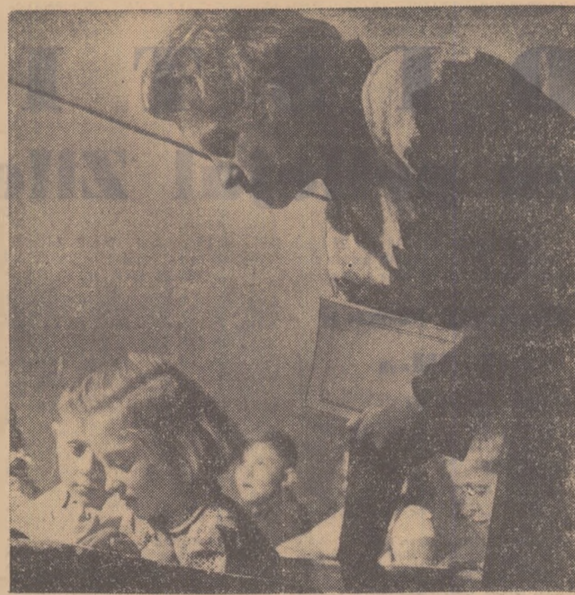
„Când m-aplec peste mici pupitre de lemn...”