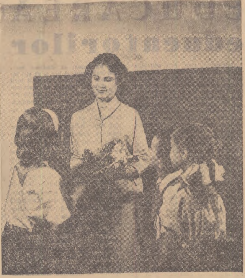
CELE MAI FRUMOASE FLORI.