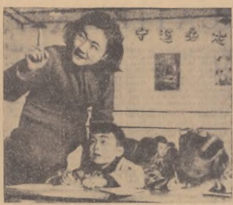
O tînră învățătoare din China Nouă.

Comitetul pe întreaga țară al Consiliului politic consultativ a creat o academie socialistă. Comitetele locale ale consiliului politic consultativ și organizațiile populare cărora le revine sarcina educării intelectualilor se ocupă temeinic de antrenarea acestora în studierea marxism-leninismului și în participarea la viața obștească și la munca practică. „Dacă vom lua o poziție activă, sinceră și plină de tact”, scrie ziarul „Jenminjibao”, — vom putea cu siguranță să ajutăm citorva milioane de intelectuali din întreaga țară să îndeplinească, în actuala perioadă de mare transformări istorice, sarcina nobilă a autoeducației, a autoreducării”.