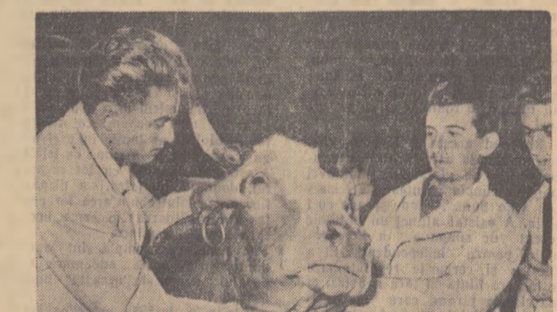
La Facultatea de medicină veterinară a Institutului agronomic din Arad.