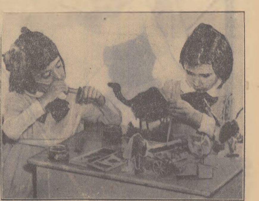
În grădinița de copii nr. 81 din cartierul muncitoresc C.F.R. Giulești