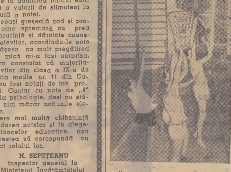
Antrenament de baschet la școala medie sportivă din București

De cîrind, reprezentanții companiei cinematografinice americane Metro-Goldwin-Mayer (M.G.M.), care furnizează filme indonezilor a organizat la Bandung un „film-bal”. Ce este „film-bal”? O definiție precisă ar fi greu de găsit. Ceea ce se poate afirma însă cu toată siguranța este că acei — de-a-luce cu o țară manifestarea a „modului de viață american”. În cazul de față lucrurile s-au petrecut în modul următor. La hotelul olandez „Homan”, organizații au pus la cale o distracție curaj americană; vizionarea unor filme americane deernarea de premii tinerilor invitate și amfite de băutură, execuțarea de către jazz a stridentilor rock and roll” și de manifestare trebuia să li fost curmată prin măsură polițienească. La Consiliul municipal din Bandung s-a prezentat o delegație a comitetului indonezian pentru combaterea imoralității — comitee care grupează 41 de organizații de tineret, femei, studențești, de profesori, veterani de război etc. — și a exprimat un protest hotărît împotriva organizării unor asemenea reuniuni în Indonezia. Se vede treaba, că popularizarea „modului de viață american” deși costă scump, merge greu și „dansuri proteste” și be-