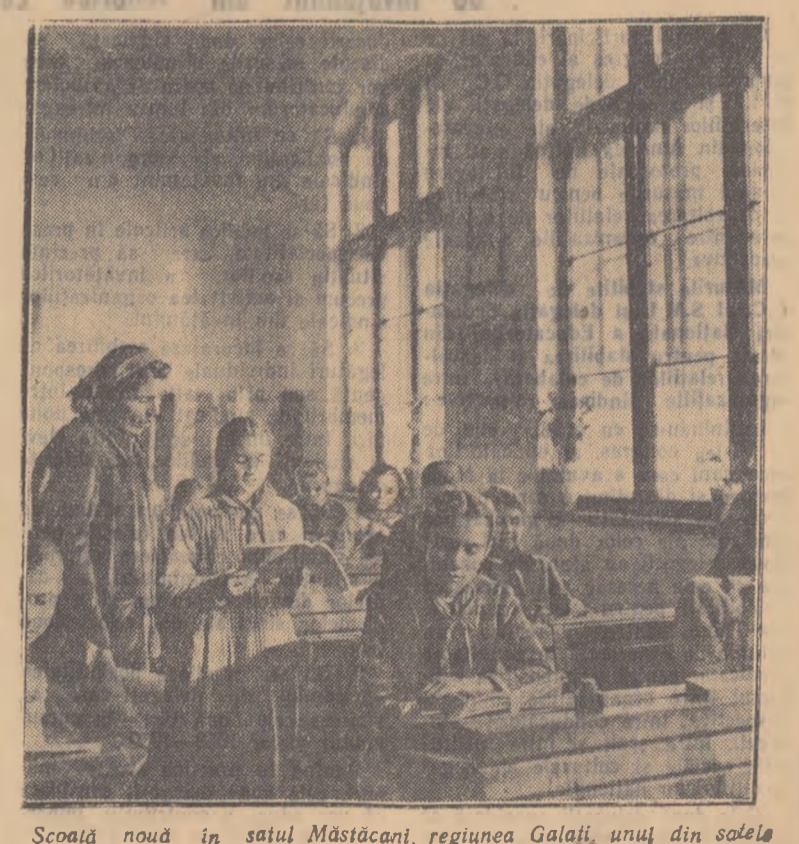
Școala nouă în satul Măstăcani, regiunea Galați, unul din școlile răscolite în 1907.