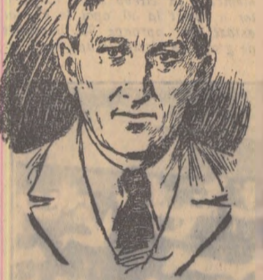
Indrumaaza și pe unii și pe ceilalți. Uneori analiza lecției se transformă într-o discuție scurată...