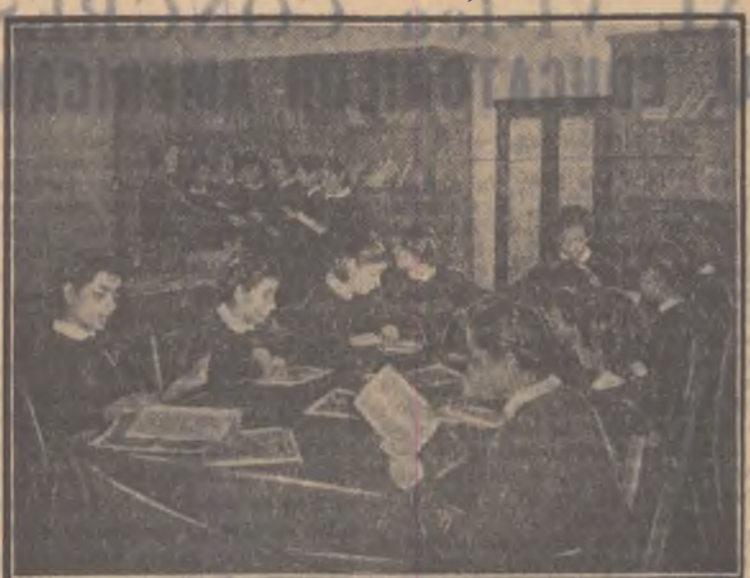
In biblioteca şcolii medii nr. 3 din Craiova.