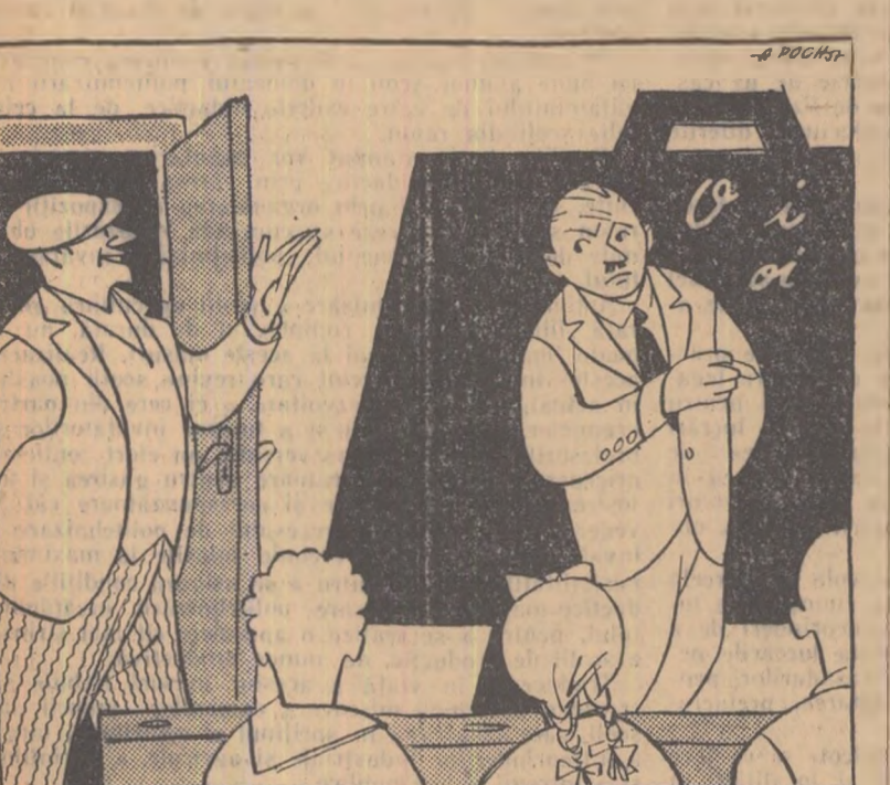
INVATATORUL: Fiți atenți, copii! PREȘEDINTELE: Perfect! Văd că te pricepi. Treceți imediat la numărarea oilor din comună! Desen de A. POCH