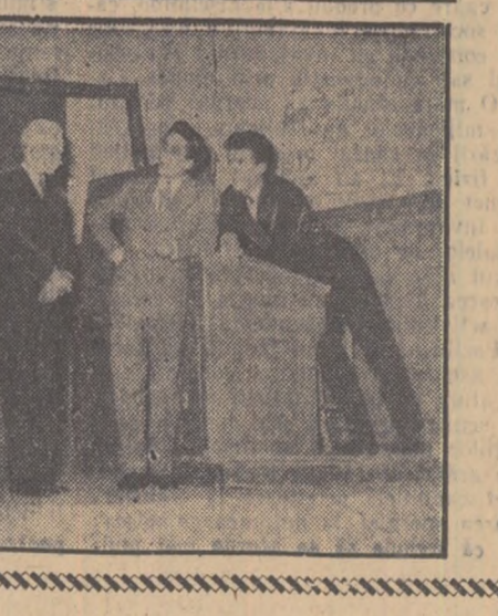
LA CASA DE CULTURA A STUDENȚILOR DIN BUCUREȘTI: în sala de lectură; un spectacol al teatrului „C. Nottara” în sala de jocuri.