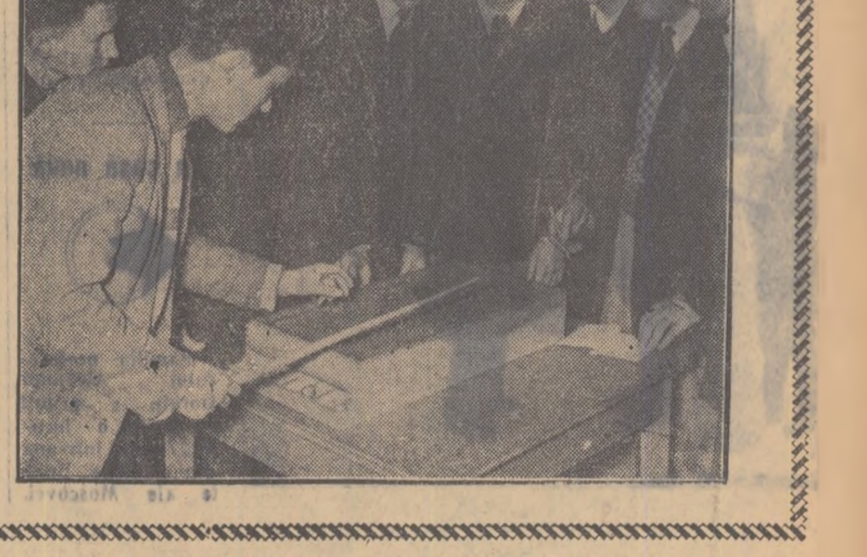
LA CASA DE CULTURA A STUDENȚILOR DIN BUCUREȘTI: în sala de lectură; un spectacol al teatrului „C. Nottara” în sala de jocuri.