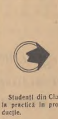
Studentii din Cluj în practică în producție.