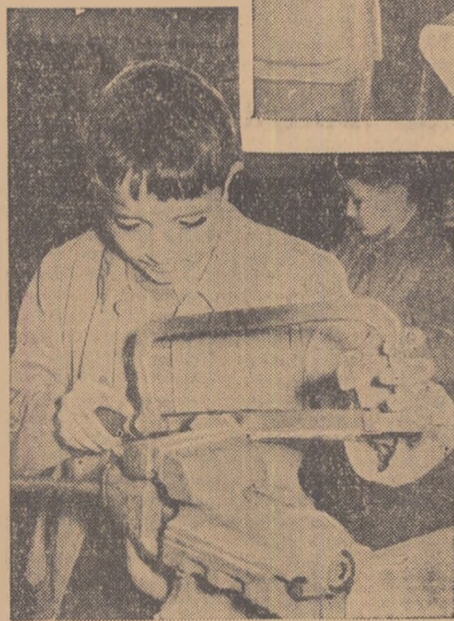
Elevii școlii medii nr. 1 din Timișoara dobîndesc temeînice deprinderi practice în atelierele școlii.