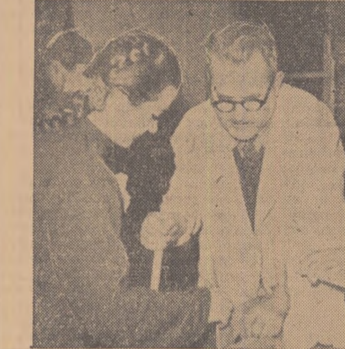
Un grup de copii și profesor lucrează într-o ateliera de lăcătușerie.