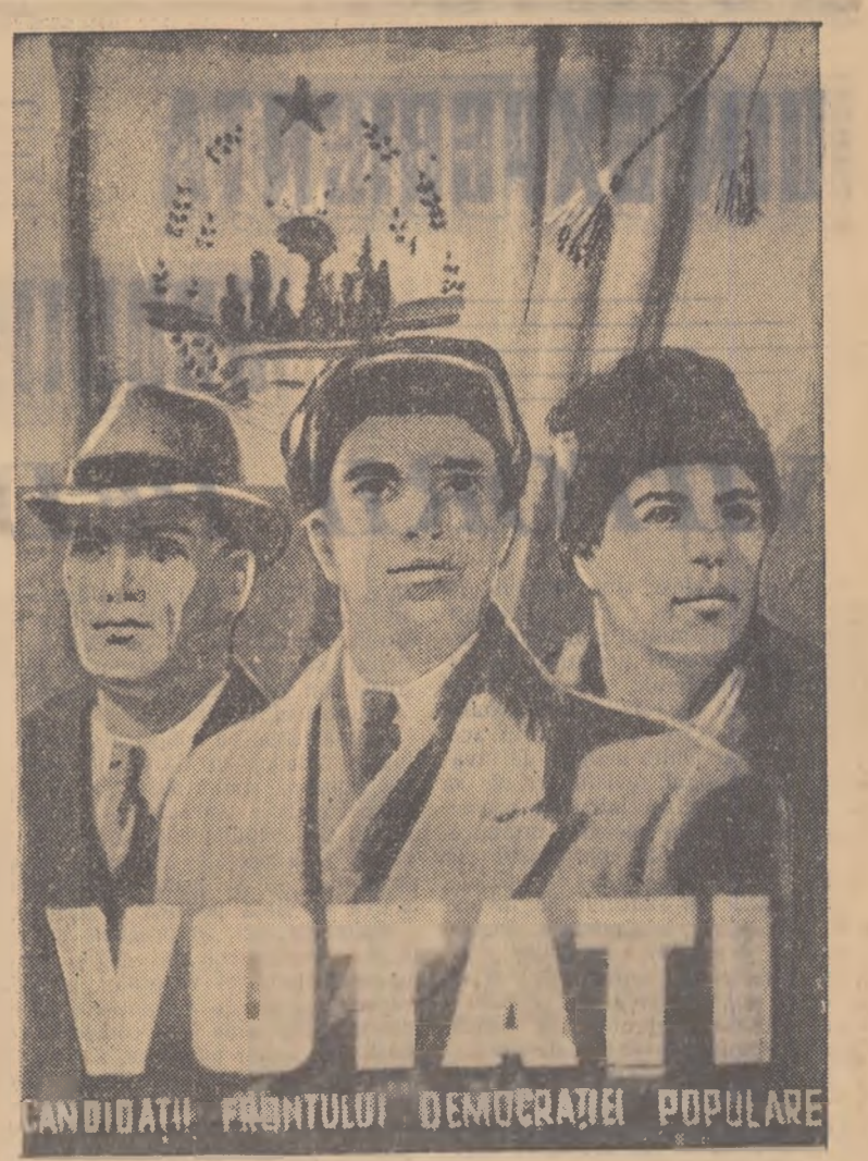
CANDIDATĂ FRONTELUI DEMOCRATIEI POPULARE