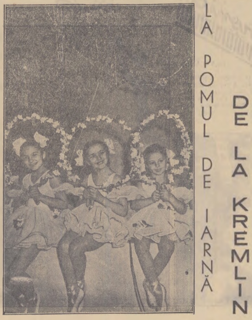
LAPOMUL DE LA KREMLIN

An de an crește baza materială a instituțiilor de învățămînt superior din Iași. Institutul agronomic, de exemplu, își desfășoară activitatea într-o clădire nouă. Studenții leșeni au la dispoziție o policlinică modernă. În timpul liber studenții leșeni petrec plăcut și instructiv; frecventează spectacole, audiază concerte, organizează excursii, reumun.