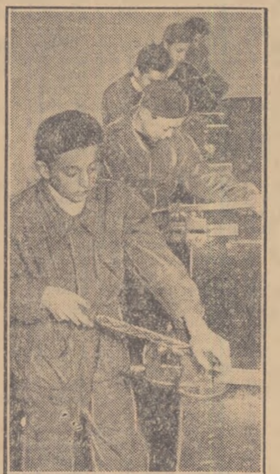
Elevii pilesc fețele dornului.

VIII-a „A” sînt foarte bucuroși și își vor primesc, odată cu pregătirea teoretică, și pregătirea practică. Ei se interesează îndeaproape nu numai de rezultatele, pe care le obțin în lecții, ci și de calitatea muncii lor în atelier. Mulți dintre ei sînt chiar muncitori în Uzinele Grișia Roșie. Aceștia părinți se gîndesc cu bucurie la ziua cînd alături de ei vor veni să lucreze propriii lor fii, ca ingineri sau ca tehnicieni. Ei vor presta 300 de