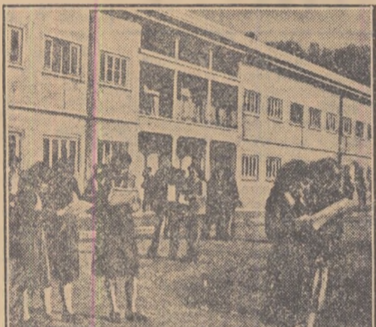
Studenți ai Institutului Tehnic „17 Noiembrie” din Tirana