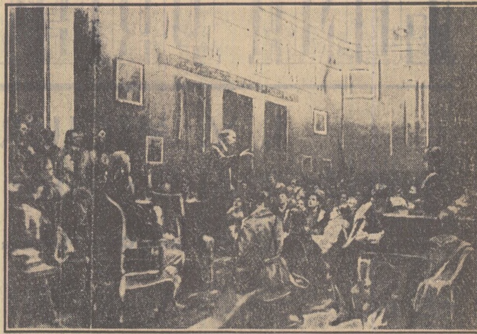
Lenin vorbind la Congresul al III-lea al Comsomolului.

Realizările obținute în primii cinci ani ai planului de electrificare a țării constituie o nouă și puternică confirmare a justității politicii partidului și guvernului nostru, politica ce pornește de la interesele fundamentale ale poporului și se bizuie pe marea și înepuzabilă forță a poporului, pe capacitatea creatoare ale oamenilor muncii. Poporul nostru, strîns unit în jurul partidului și guvernului și bucurîndu-se de ajutorul frățesc al Uniunii Sovietice și al țărilor de democrație populară și