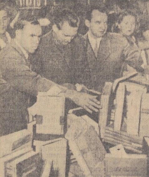
Aspect de la deschiderea Bazarului cărții sovietice din Capitală, organizat cu prilejul Lunii prieteniei romino-sovietice.