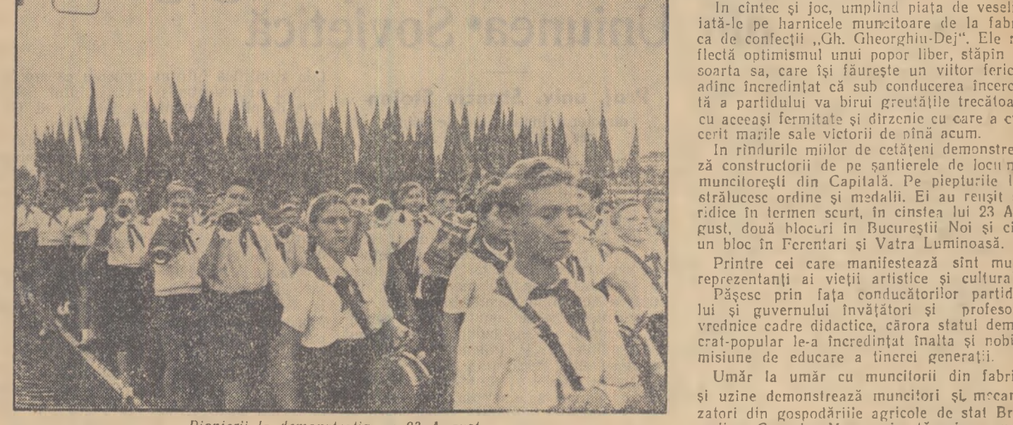
Pionierii la demonstrația de 23 August