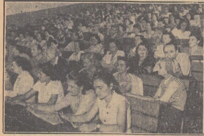
La consfaturile cadrelor didactice din raionul Stalin-Bucuresti