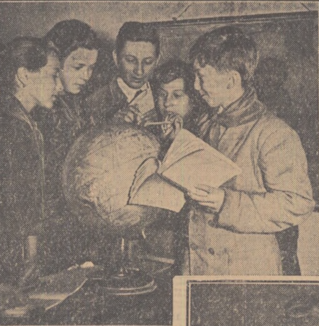
In clișeu de sus: După o lecție interesantă de geografie, elevii clasei a VII-a se string în jurul globului geografic, discutînd cu însușirile.

La școala de șapte ani din comuna Străoane, raionul Panclu, regiunea Brlad, cadrele didactice desfășoară o rodnică activitate instructiv-educativă. Străduindu-se să lege strîns cunoștințele teoretice predate elevilor de practică, învățătorii și profesorii școlii din comuna Străoane folosesc la lecțiile lor un bogat material intuitiv. În același timp, în școală se duce o intensă activitate în cercurile de elevi, iar organizația de pionieri, prin adunări tematice interesante, contribuie și ea la adîncirea cunoștințelor copiilor și la legarea acestor cunoștințe de practica construirii socialismului în țara noastră.