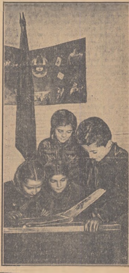
In clișeu de sus: În camera pionierilor, copiii se pregătesc pentru o adunare tematică.