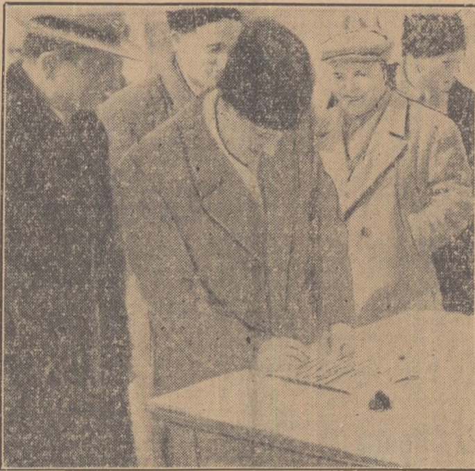
La școala medie mixtă din Corabia, Apelul a fost semnat cu multă însușețire