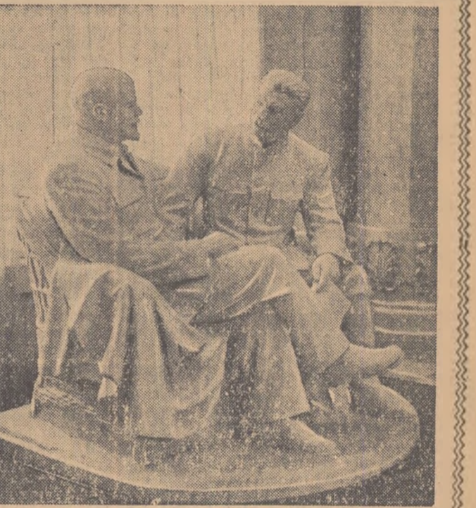
Un aspect din sălile muzeului

Grupuri de oameni cu carnet de însemnări în mîini se apleacă asupra vitrinelor cu documente care reflectă lupta partidului, a lui Lenin și Stalin, în anii grei ai reacțiunii staliniste. În vise de marmora, sub cristal, sînt expuse volume vechi, cu file îngălbenite, răsfoite de muni aspre de muncitori: prima ediție rusă, tipărită în 1902, a genialei lucrări leniniste „Ce-i de făcut”, prima ediție rusă a cărții „Un pas înainte, doi pași înapoi” și a cărții „Două tactici ale social-democrației în revoluția democratică”, precum și altele lucrări ale marelui Lenin.