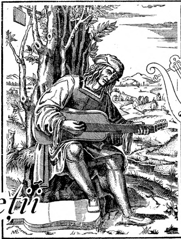
După o gravură din Secolul al XVI-lea a lui Marcantonio Raimondi.