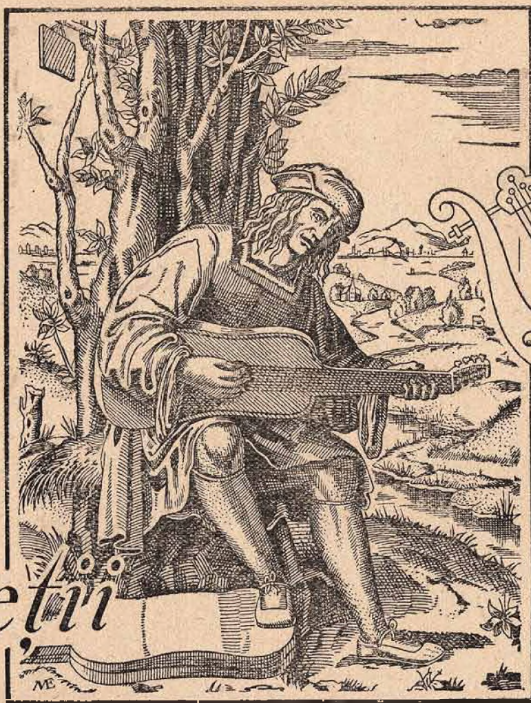
După o gravură din Secolul al XVI-lea a lui Marcantonio Raimondi.