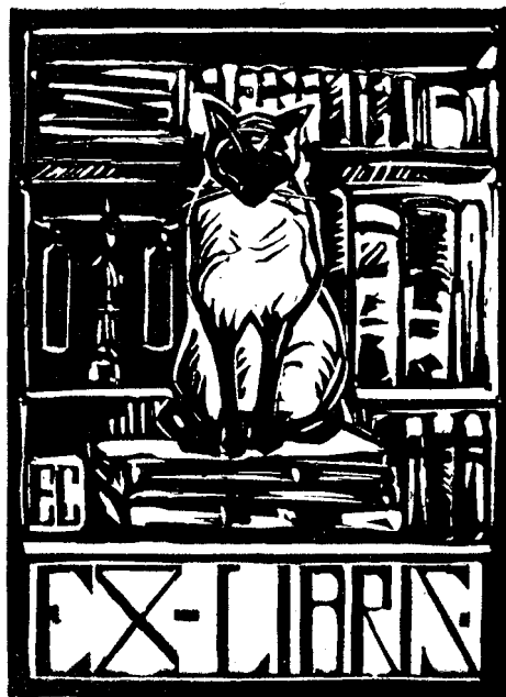
Xilografie de D-na M. D.

Pe-aici - afară de oraș - și ieri am fost să iscodim învierile în fața porților. Indrăznește soro. Ah soro să nu suspini. Intr'o singură zi mugurii și iarba au crescut repede ca unghiile și părul morților.