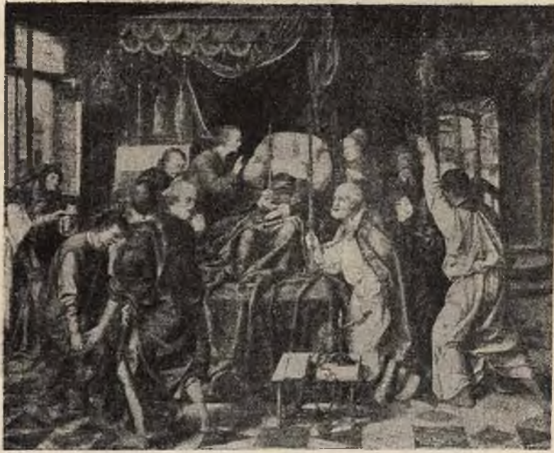
Joos V Cleve