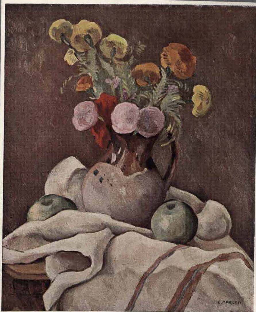
THEO-SION : Flori