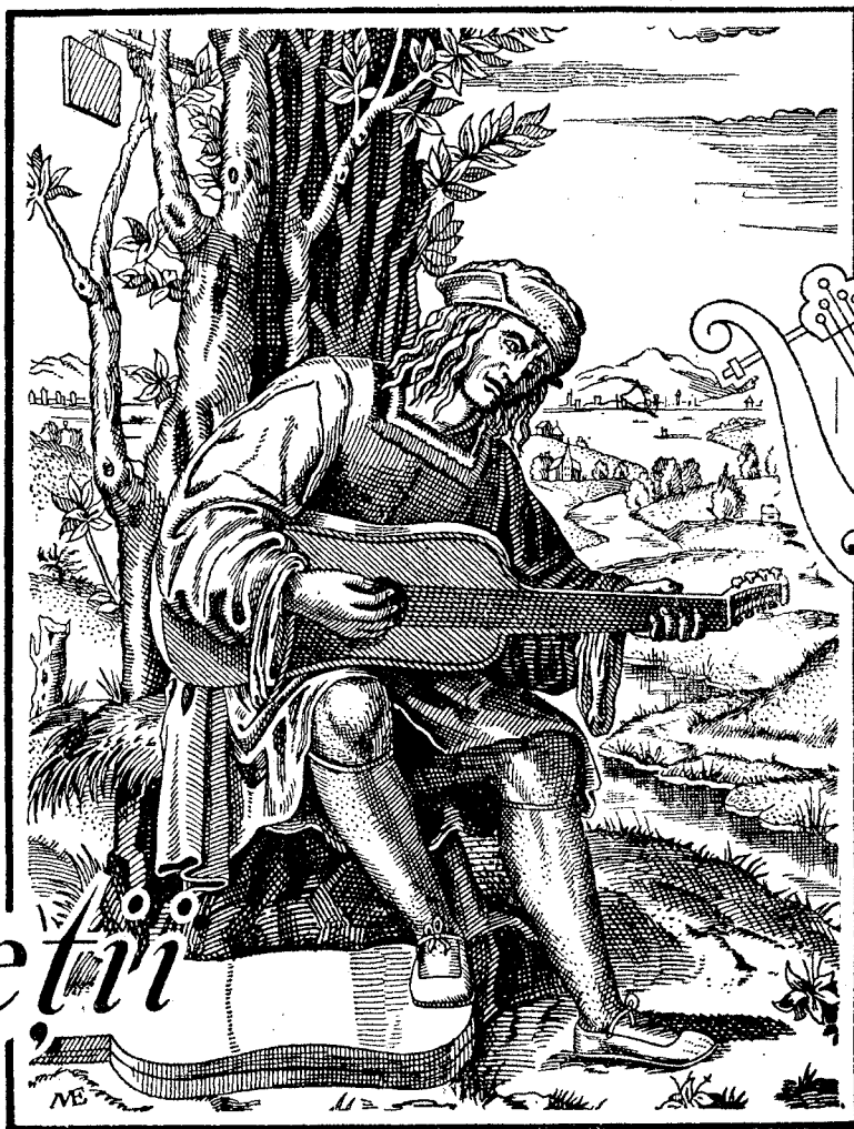
După o gravură din Secolul al XVI-lea a lui Marcantonio Raimondi.