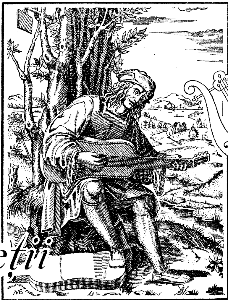
După o gravură din Secolul al XVI-lea a lui Marcantonio Raimondi.