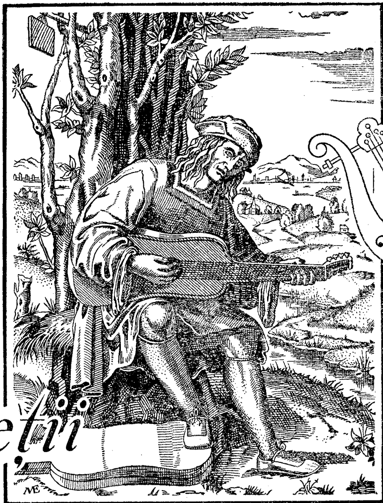
După o gravură din Secolul al XVI-lea a lui Marcantonio Raimondi.