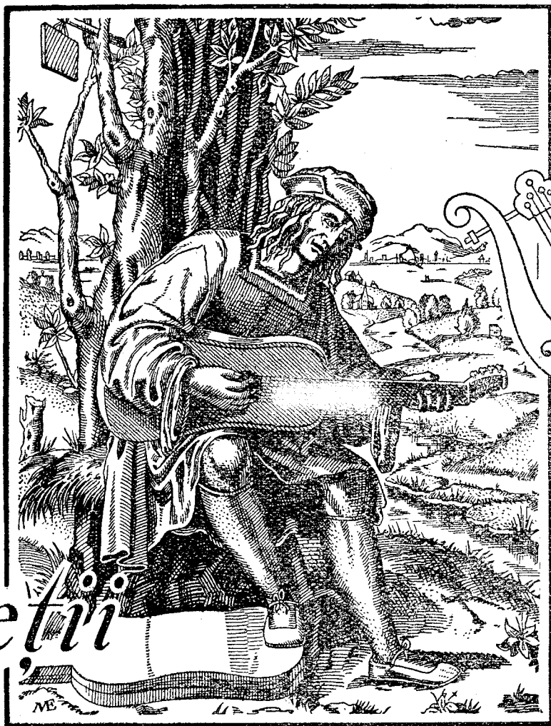
După o gravură din Secolul al XVI-lea a lui Marcantonio Raimondi.