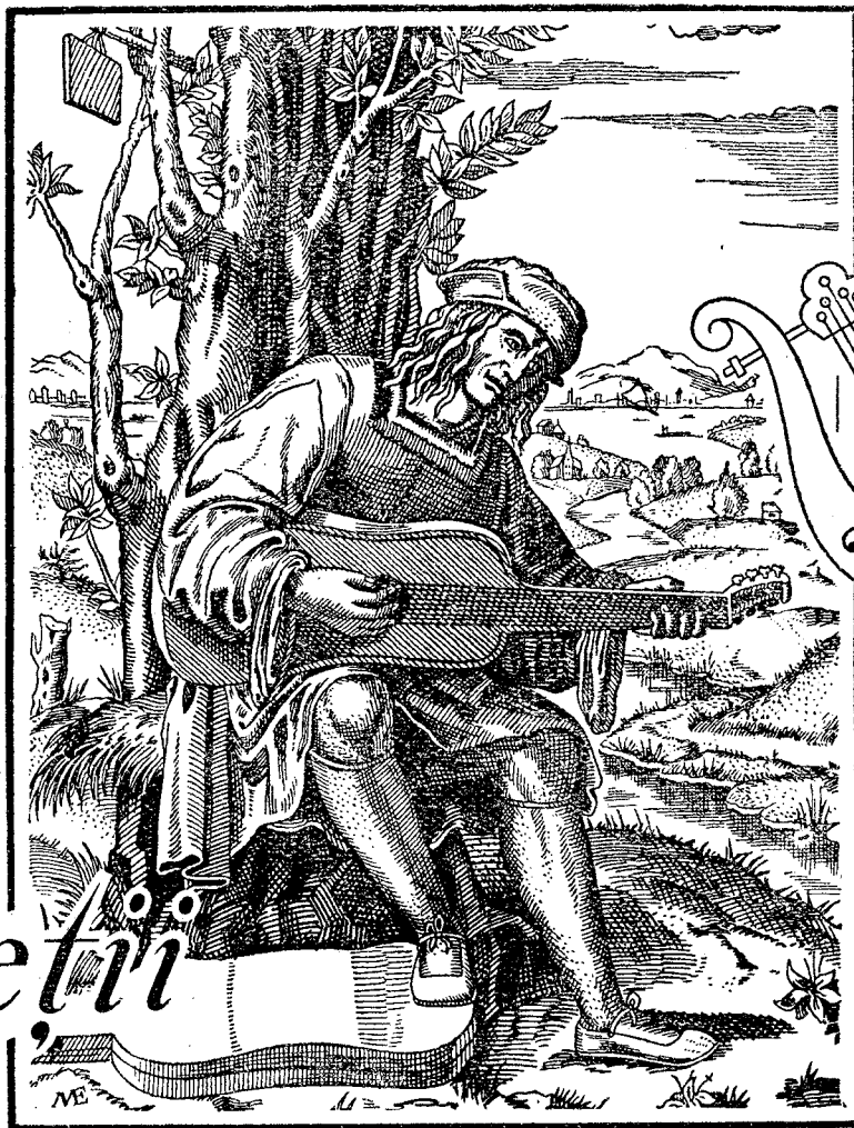
După o gravură din Secolul al XVI-lea a lui Marcantonio Raimondi.