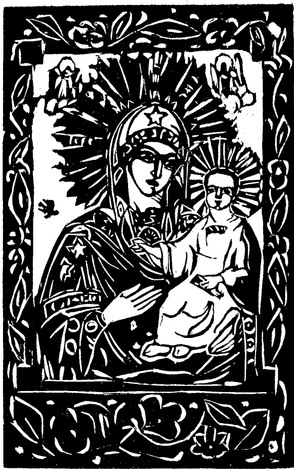
Xilografie de D-na M. D.

Aflând minunea, vânătorii aceia s'au rădicat cu toții părăsind corabia și-au grăbit înspre biserica din pustie. Au pătruns în lăuntru cu înfrângere și sfială, dar în umbră, după mreaja ruptă de painjen, n'au mai găsit trupul fericitei. Cu mirare și spaimă au ieșit afară căutând pretutindeni, dar nu l-au găsit nici în câmpia din preajmă, nici în dumbravă, și nicăiri subt cer, între țarmurii ostrovului.