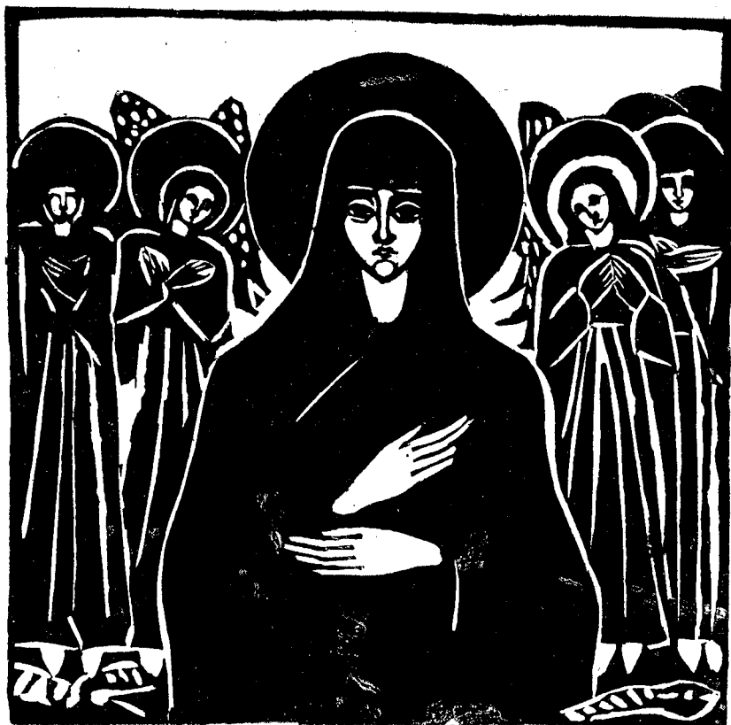
Xilografie de D-na M. D.