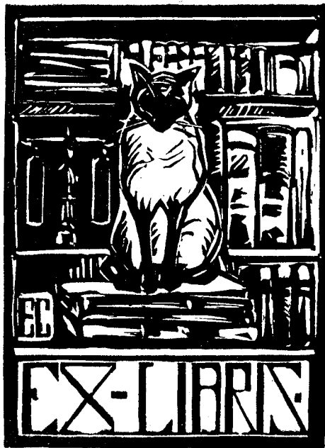
Xilografie de D-na M. D.

Pe-aici — afară de oraș — și ieri am fost să iscodim învierile în fața porților. Indrăznește soro. Ah soro să nu suspini. Intr'o singură zi mugurii și iarba au crescut repede ca unghiile și părul morților.