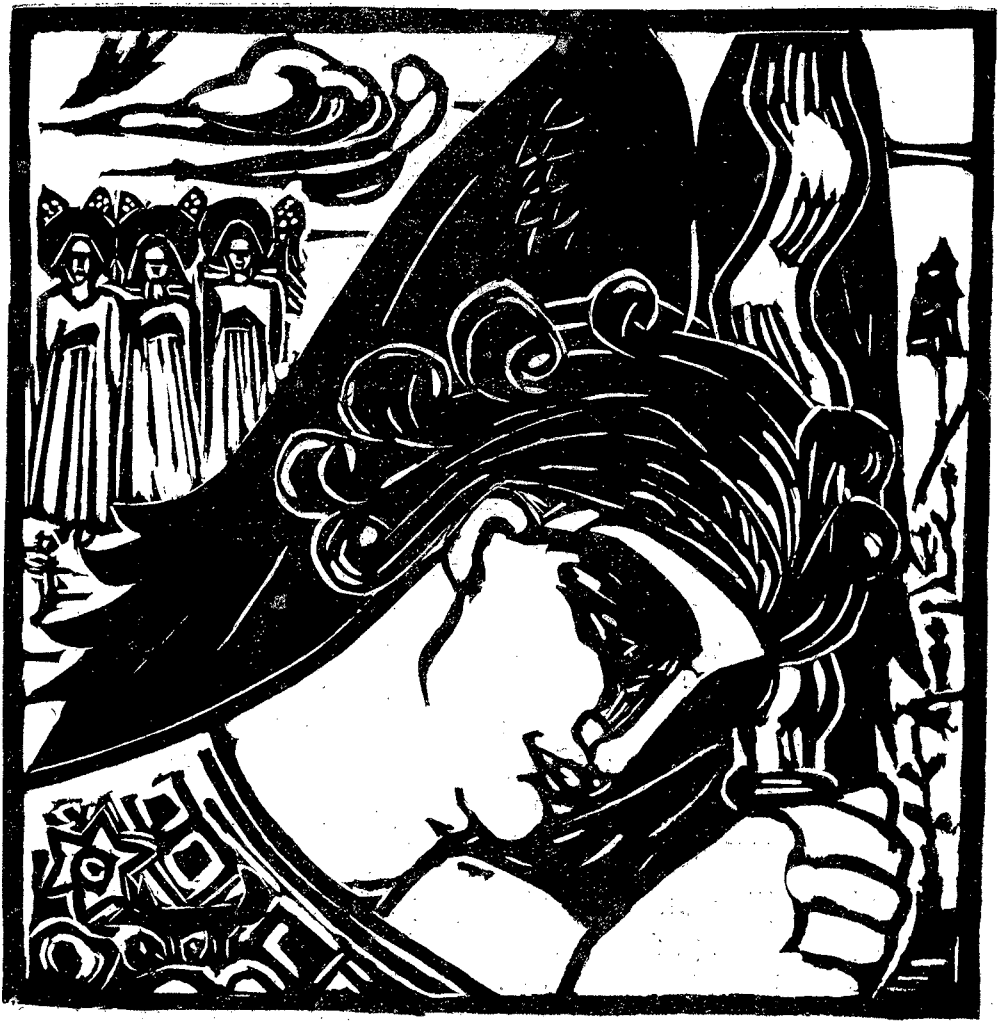
Xilografie de D-na M. D.