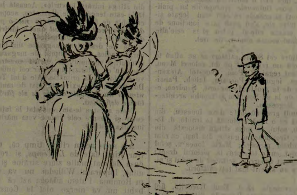
— Mamă, tîndrul tot ne urmează... — Ridică-ți bine fusta... să vadă că ai lenjerie...

Iată ce zice, în această materie, Reglementul de construcțiuni: